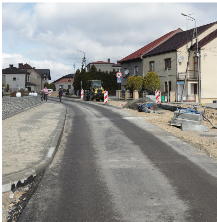
ul. Raciborska w Rogowie

W ramach zadań realizowanych przez Międzygminny Związek Wodociągów i Kanalizacji (i PWiK), a współfinansowanych przez gminę trwają procedury mające na celu wyłonienie wykonawcy budowy kanalizacji sanitarnej w Gorzycach i Osinach wzdłuż ul. Raciborskiej . Pierwszy przetarg został w styczniu unieważniony, ponieważ najkorzystniejsza oferta przekraczała znacząco kwotę przeznaczoną na realizację zadania. Ponieważ pozyskane dofinansowanie nie ulegnie zwiększeniu - zmodyfikowany został jego zakres. Rozpisany został drugi przetarg.