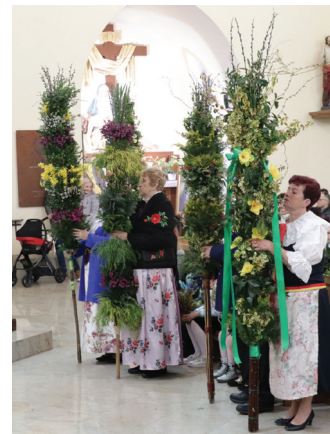
Tegoroczne Gminne Palmy Wielkanocne