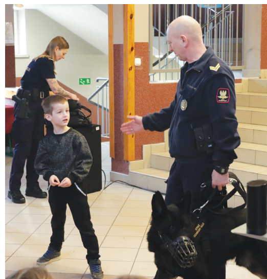
Dzieci chętnie czynnie brały udział w spotkaniu