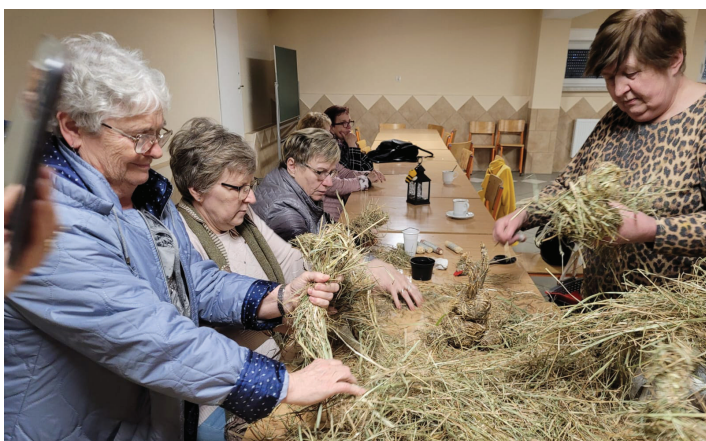
Warsztaty wyplatania wielkanocnych ozdób