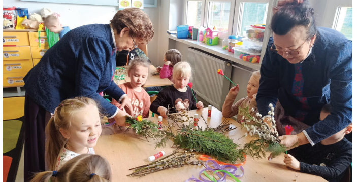
Dzieci robią tradycyjne palmy wielkanocne