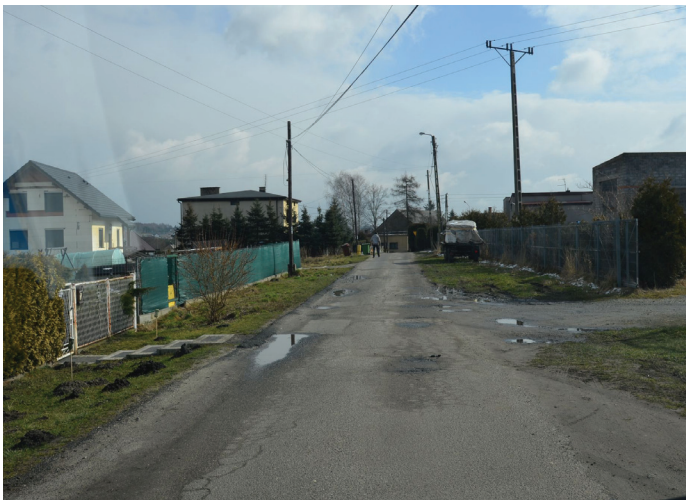
ul. Mickiewicza w Gorzycach

W związku z pozyskanymi środkami zewnętrznymi rozpisany został również przetarg na wykonanie odwodnienia wraz z odtworzeniem nawierzchni asfaltowej na ul. Zwycięstwa w Turzy Śl. Zakres robót obejmuje m.in. przebudowę odwodnienia – rowu, przebudowę