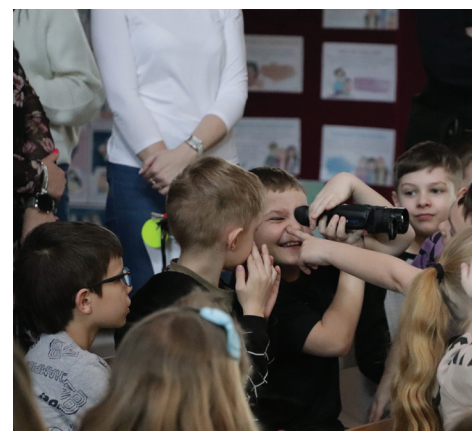
Noktowizor zaciekał uczestników spotkania

przyrządów. Funkcjonariusze pokazali także, jak działa paralizator elektryczny i w jakim celu jest wykorzystywany. Zaprezentowali również umiejętności psa patrolowego oraz wyjaśnili zasady zachowania się wobec psów. Na zakończenie spotkania przedstawiciele PKP przekazali uczniom różnego rodzaju upominki w formie książek edukacyjnych, kolorowanek, znaczników odbłaskowych, długopisów oraz słodkich „firmowych” krówek.