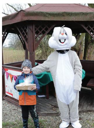
Hazok dzielący prezentami w Belsznicy