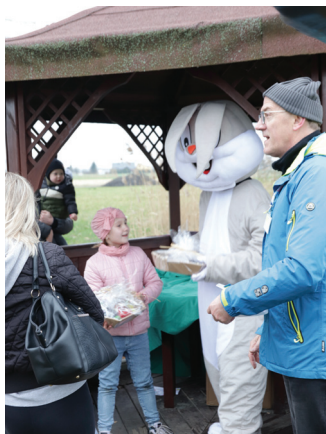
Dzieci były zadowolone z hazokowych prezentów