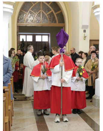
Procesja z palmami w kościele