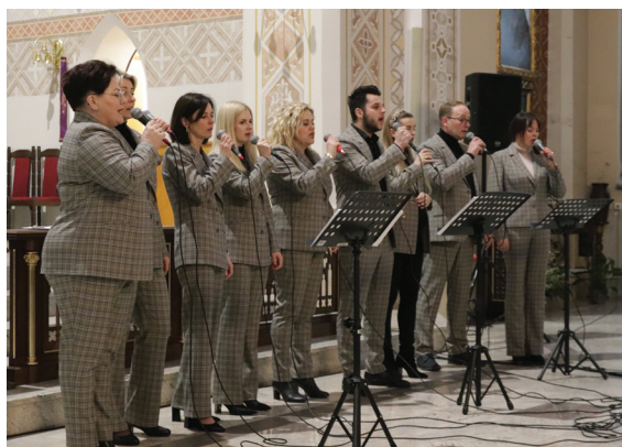
„Vocalsi” podczas kwietniowego koncertu w Gorzycach