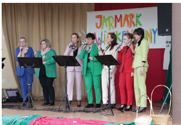
Zespół „Ale to już było” podczas występu w Olzie