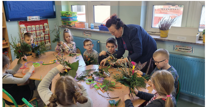
Panie z KGW Bluszczów uczą, jak zrobić tradycyjną palmę wielkanocną