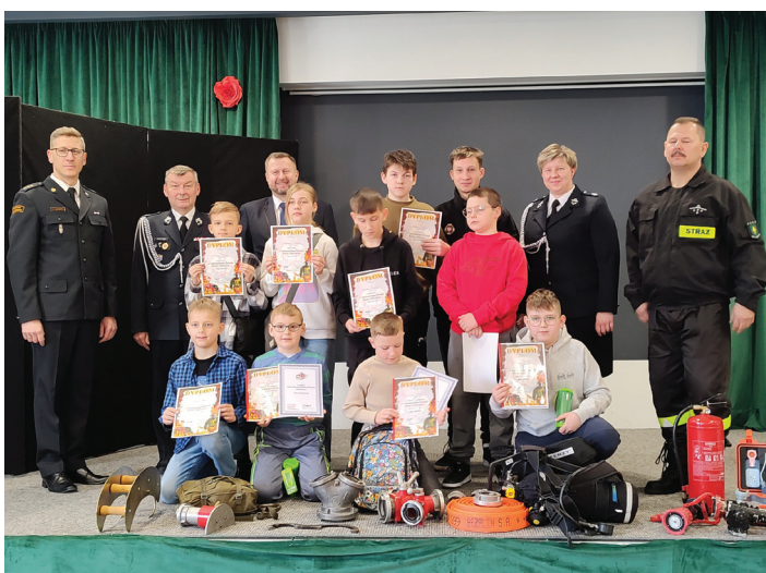
Grupa uczestników reprezentująca Bluszców w eliminacjach