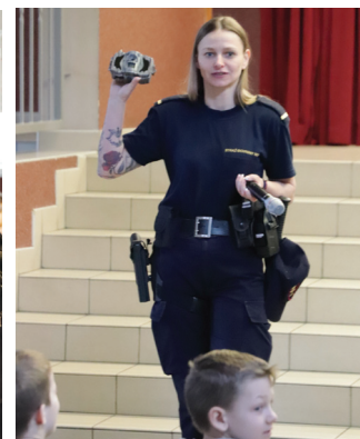
Poznawanie narzędzi pracy pracowników Służby Ochrony Kolei

Szczególnym zainteresowaniem cieszyła się prezentacja pracy Służby Ochrony Kolei oraz jej towarzyszy - pies patrolowy. Uczniowie poznali najważniejsze urządzenia wykorzystywane w pracy takie jak: noktowizor, kajdanki i lornetki. Mieli także możliwość sprawdzić działanie tych