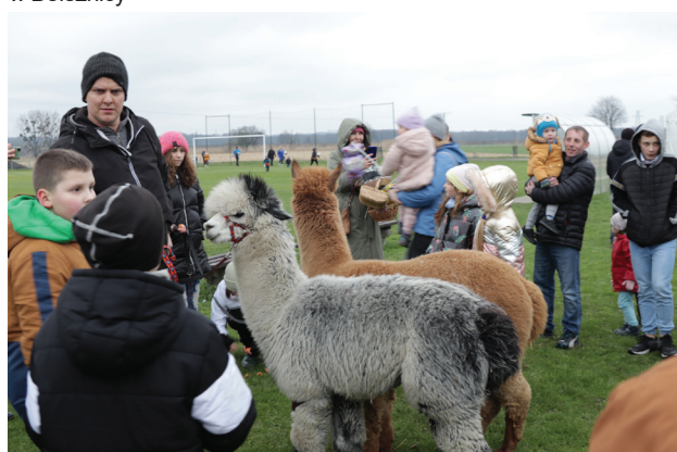
Dzieci mogły również spotkać się z lamami podczas sobotniej zabawy na stawach belsznickich