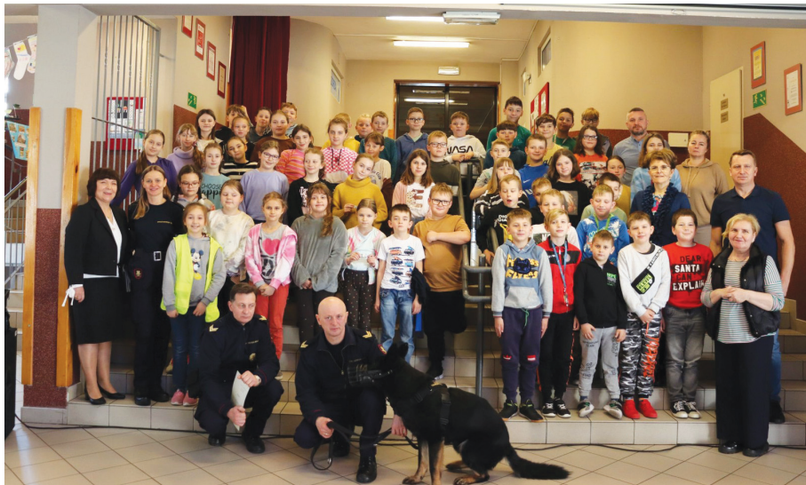
Uczestnicy spotkania „Bezpieczny przejazd - szlaban na ryzyko” w ZSP Czyżowice