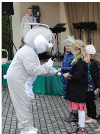
Hazok podczas zabawy z dziećmi w Olzie

Nowa tradycja w Belsznicy; „Hazok na Stawach”. Pomysł, który zrodził się w głowie instruktora Świetlicy Wiejskiej w Belsznicy przy ogromnym wsparciu Rady Sołeckiej na czele z sołtysem, został zrealizowany w dniu 2.04.2023 r. (w Niedzielę Palmową), kiedy to społeczność belsznicka mogła spotkać na pierwszej imprezie plenerowej pt. „Hazok