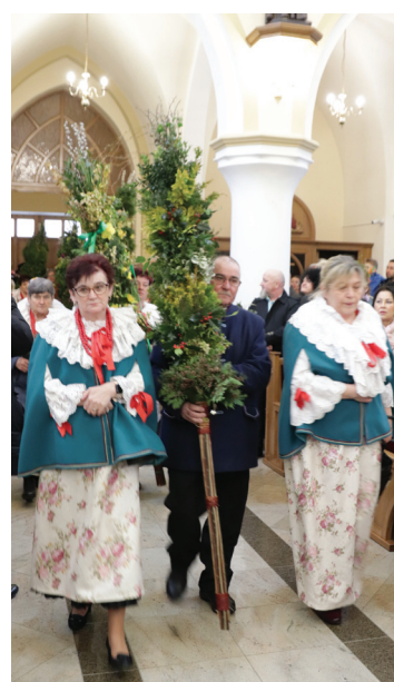
KG i GW Kolonia Fryderyk