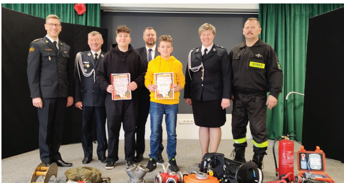
Grupa uczestników reprezentująca Turzę Śląską w eliminacjach