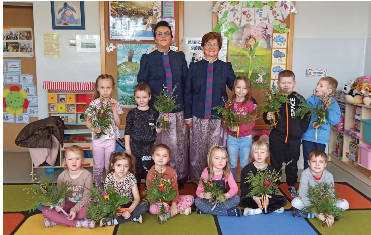
Panie z KGW Bluszczów i młodzi uczestnicy warsztatów

Dnia 28 marca 2023 r. w Oddziale Przedszkolnym w Bluszczowie panie z Koła Gospodyń Wiejskich z Bluszczowa zorganizowały dla przedszkolaków warsztaty, podczas których pokazały dzieciom, jak powstają palmy wielkanocne. Była to również okazja do przekazania najmłodszemu pokoleniu tradycji wielkanocnych.