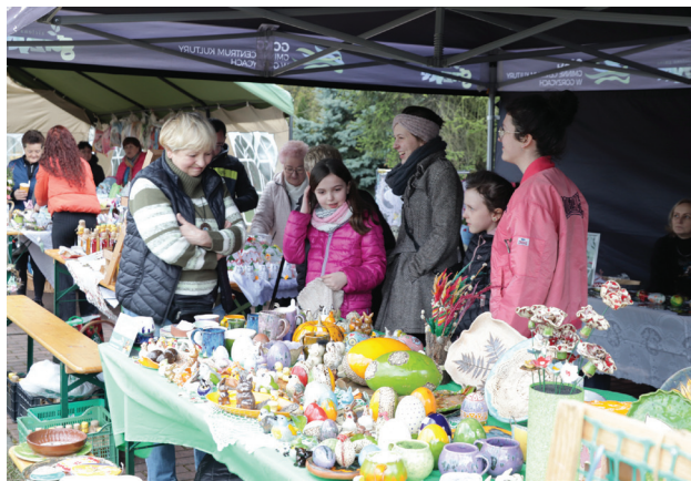
Jedno ze stoisk podczas Jarmarku Wielkanocnego w Olzie