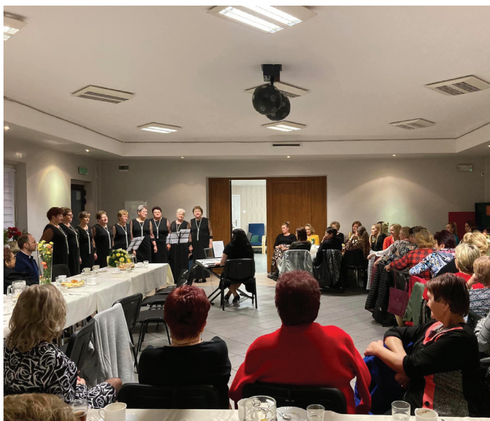
Uczestnicy Dnia Kobiet w Bełsznicy