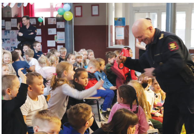
Dzieci chętnie poznawały sprzęt, który przywieźli ze sobą kolejarze

Przedstawiciele różnych formacji kolejowych przybliżyli uczniom i przedszkolakom specyfikację pracy na kolei. Uczniowie poznali najważniejsze zasady bezpieczeństwa związane z przejazdami kolejowo – drogowymi, dzikimi przejściami przez tory kolejowe a także uzyskali wiedzę na temat podróżowania koleją. Cały materiał ukazany został w ciekawej prezentacji multimedialnej wraz z omówieniem przez pracownika PKP PLK. Podsumowaniem przekazu był krótki quiz, w którym uczniowie mogli sprawdzić swoją wiedzę.