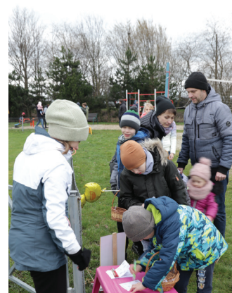
Dzieci miały wiele zajęć w Belsznicy