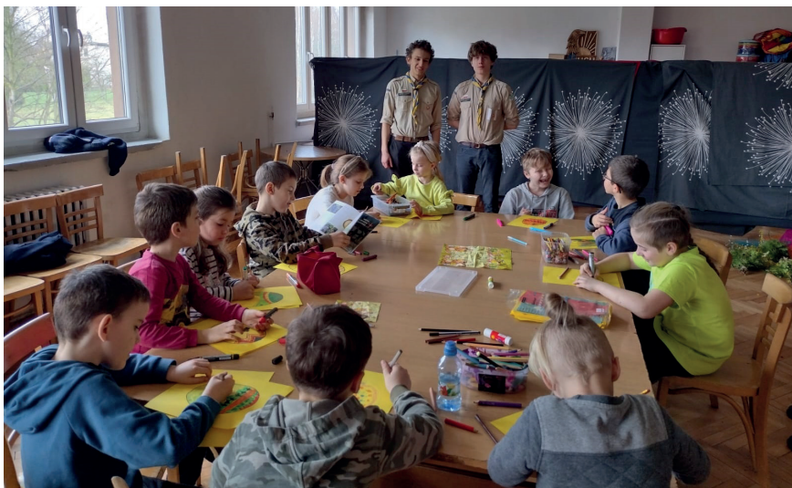
Czyżowickie „Czyżyki” uważnie słuchają Skautów Europy