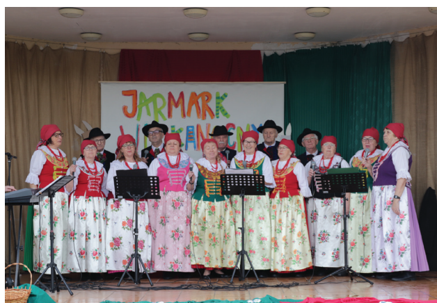
„Gorzyczanie” na olzańskiej scenie podczas występu