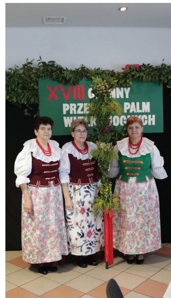
KGW Turza Śląska