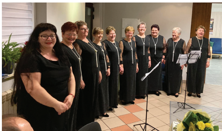
„Bełszniczanki” podczas występu