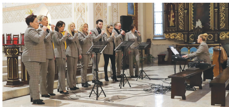
Vocalsi podczas kwietniowego koncertu w Gorzycach