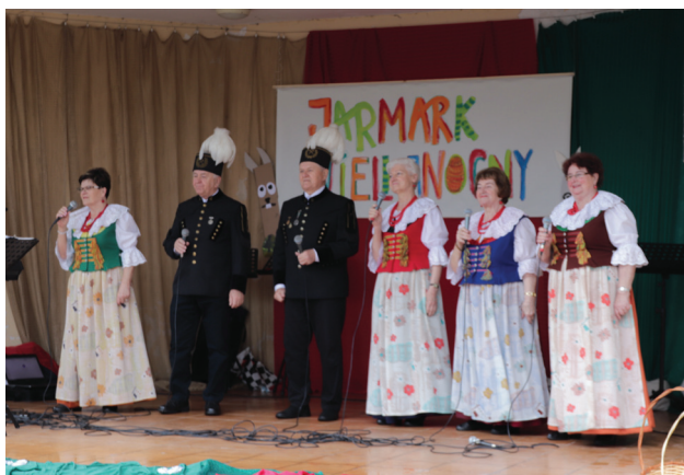
„Olzanki” podczas występu w Olzie na Jarmarku Wielkanocnym