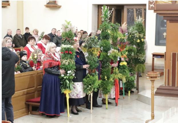
Uroczysta Niedziela Palmowa w rogowskim kościele