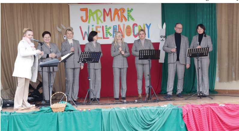
„Vocalsi” podczas występu w Olzie