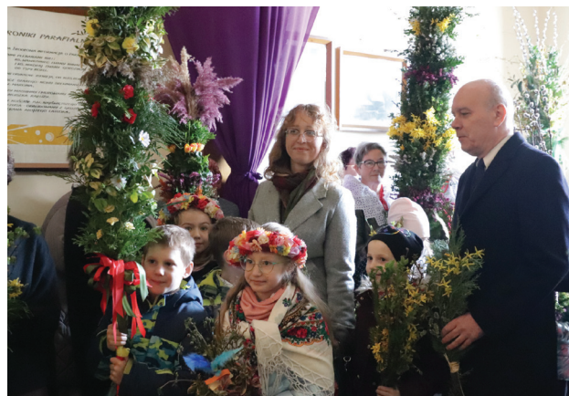
Uczestnicy niedzielnej procesji