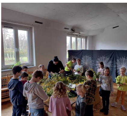
wspólne tworzenie palm wielkanocnych