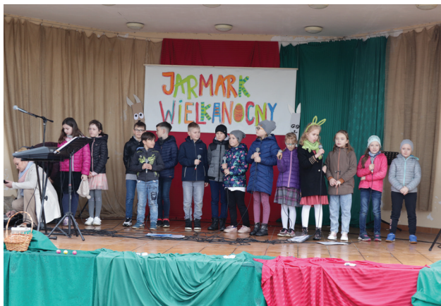
Grupa z ZSP w Olzie podczas występu