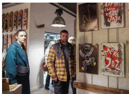
Prace artysty plastyka Marka Grzebyka