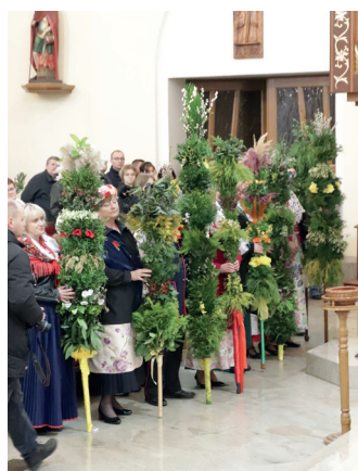
Tegoroczne Gminne Palmy Wielkanocne