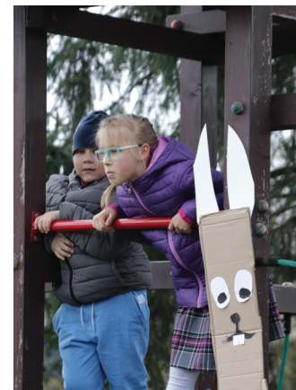
Uczestnicy jarmarku w Olzie