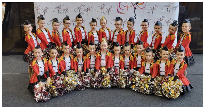
JUNIORKI Mażoretki Rapid