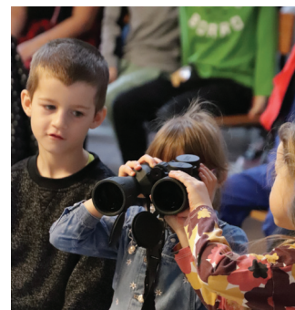
Dzieci zaciekawione lornetką

Celem programu jest przybliżenie dzieciom i młodzieży zagrożeń wynikających z braku ostrożności na przejazdach kolejowo-drogowych i wzbudzenie zainteresowania zasadami właściwego zachowania w tych miejscach oraz kształtowanie i utrwalanie postaw społecznie pożądanych.