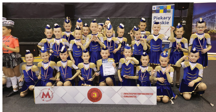
KADETKI Mażoretki Rapid