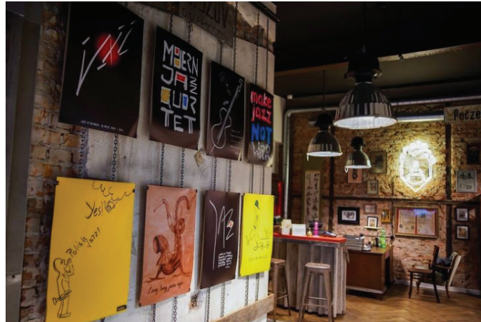
Prace z serii „Plakatu jazzowego” Marka Grzebyka