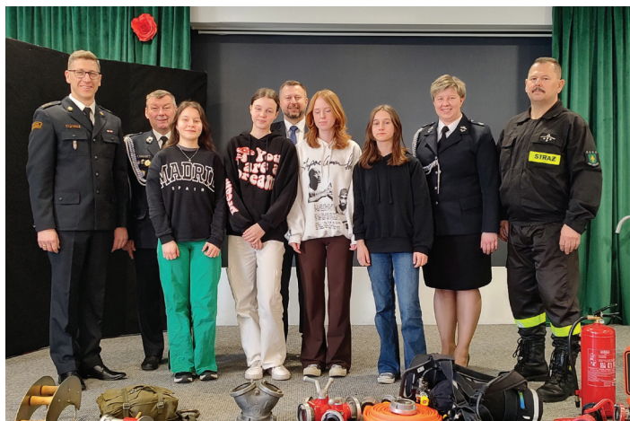
Grupa uczestników reprezentująca Olzę w eliminacjach