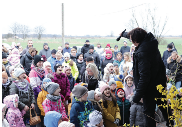
Uczestnicy spotkania z Hazokiem w Belsznicy na Stawach