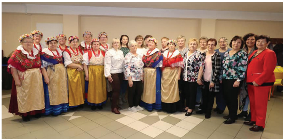
Wspólne zdjęcie pań ze Związku Śląskich Kobiet w Walcach z paniami z KGW Czyżowice

18 marca 2023 r. panie z KGW w Czyżowicach zostały zaproszone przez Związek Śląskich Kobiet Wiejskich do miejscowości Walce w woj. opolskim. Panie spędziły tam bardzo miło czas podczas różnych warsztatów, które zostały przygotowane na ich przyjazd. Dodatkową atrakcją tego wyjazdu było również zwiedzanie izby tradycji, spichlerza oraz występ lokalnego zespołu Walczanki .