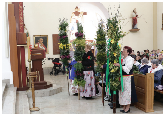
Uroczysta Niedziela Palmowa w rogowskim kościele