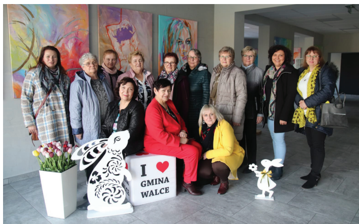
Uczestniczki wyjazdu do miejscowości Walce