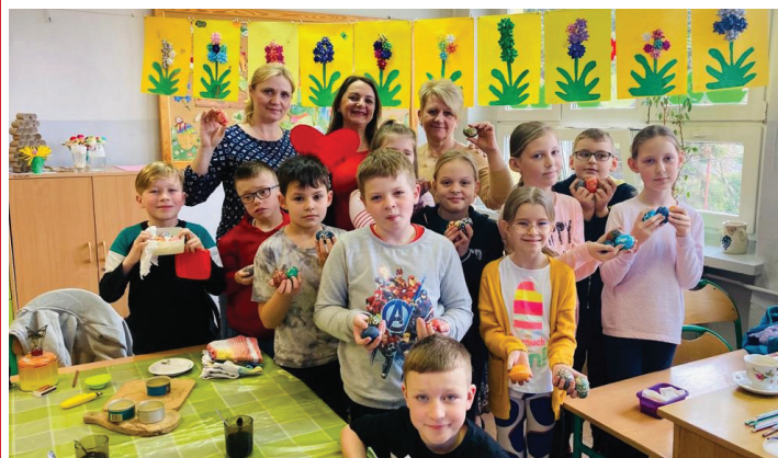
Uczestnicy warsztatów malowania pisanek