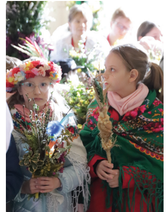
Najmłodszy uczestnicy procesji