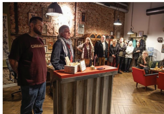
Uczestnicy spotkania w galerii „Niszovi”