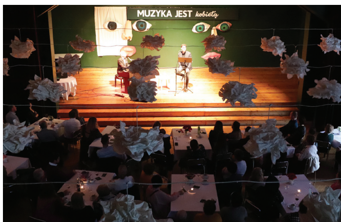
Liryczny nastrój koncertu „Muzyka jest kobietą”