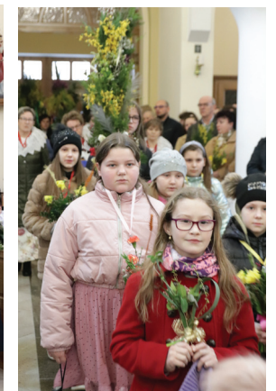
Procesja z palmami