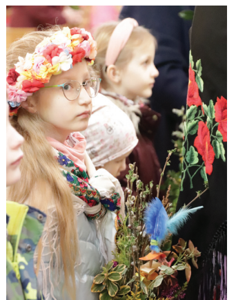
Uczestnicy Niedzieli Palmowej