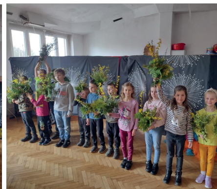
Piękne palmy, które powstały na zbiórce