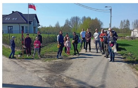
Liczna grupa dbająca o porządek

Śmieci w lesie to nadal duży problem, nad którym wszyscy musimy się pochylić, dlatego też, korzystając ze słonecznej pogody, mieszkańcy Gorzyczek, a w szczególności ci z ulicy Strzelniczej (25 osób) postanowili w ramach akcji społecznej posprzątać las w okolicy Kopca.