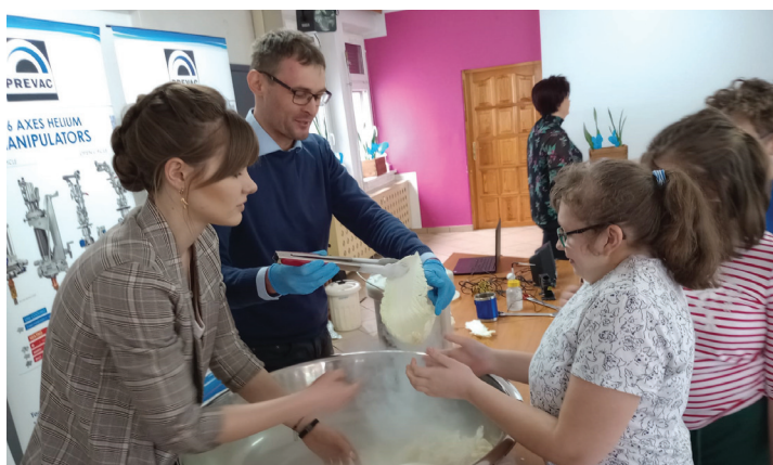
Doświadczenia pod czujnym okiem specjalistów z firmy PREVAC

18 kwietnia 2023 r. przedstawiciele firmy PREWAC, specjalizującej się m.in. w projektowaniu i produkcji kompletnych systemów pomiarowych, dostosowanych do indywidualnych potrzeb klientów jak i na dostawie komponentów próżniowych, byli gośćmi w Zespole Placówek Szkolno-Wychowawczo-Rewalidacyjnych. Każdego roku do placówki dojeżdża autobusami zapewnionymi przez gminę kilkudziesięciu uczniów z gminy Gorzyce, którzy są objęci wszechstronną opieką. Dzieci na bieżąco