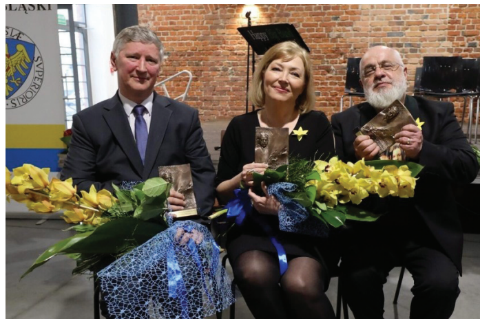
Laureaci tegorocznej edycji

kulturalnych oraz zachowanie dziedzictwa kulturowego regionu. Organizuje między innymi spotkania autorskie, promując w ten sposób wszelkie publikacje dotyczące lokalnej historii. Może też prowadzić działania na rzecz kultu religijnego, a także działalność charytatywną.