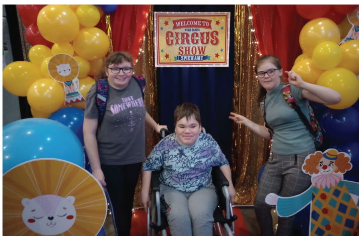
Uczestnicy Festiwalu Karaoke