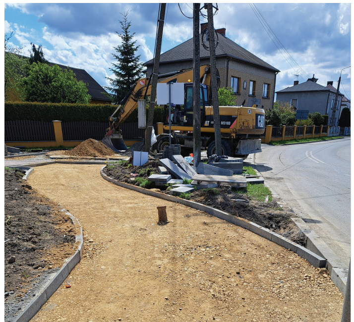
Gorzyczki, przebudowa układu komunikacyjnego