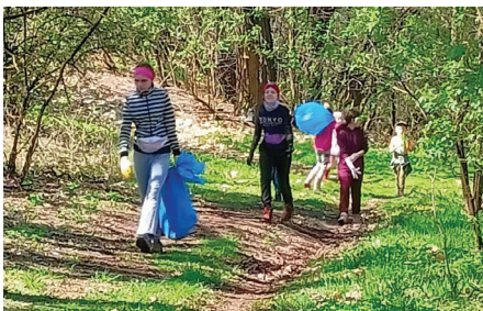
Sprzątanie terenów zalesionych