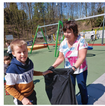
Sprzątano również teren przy OK