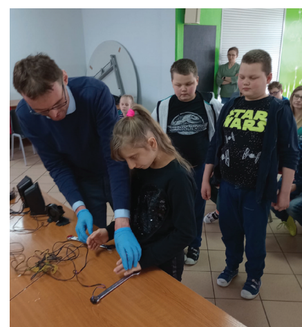
Doświadczenia pod czujnym okiem specjalistów z firmy PREVAC

korzystają z możliwości, jakie im daje uczęszczanie do placówki w niedalekim Wodzisławiu Śl. Na dwukrotnych warsztatach pt. „Doświadczamy z Firmą Prevac” przedstawiciele firmy PREVAC zrobili furorę nie tylko wśród dzieci, ale i dorosłych. Ciekawe eksperymenty i doświadczenia wywarły duże wrażenie bez wyjątku na wszystkich i zapewne na bardzo długo pozostaną w pamięci podopiecznych i pracowników szkoły. Dziękujemy za te wspaniałe doświadczenia i przeprowadzone przez Państwa eksperymenty w tak miłej i niepowtarzalnej atmosferze. Tak udane zajęcia dają nadzieję na ponowne spotkanie z Firmą PREVAC z niedalekiego Rogowa.