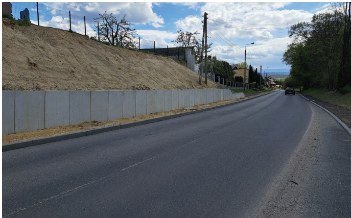
Belsznica-Rogów, ul. Raciborska w przebudowie

Jedną z największych inwestycji w naszej gminie jest modernizacja ul. Raciborskiej w Gorzycach - Osinach - Belsznicy - Rogowie. Kontynuujemy ją od kilku lat. Droga jest co prawda drogą powiatową, jednak zadanie jest współfinansowane przez gminę. Jego zakończenie jest planowane w 2023 r.