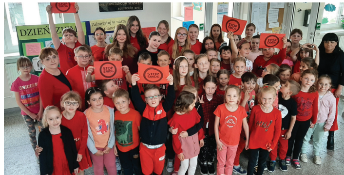
Czerwony - kolor Dnia Ziemi

"Zanieczyszczenie powietrza, smog, szkodzenie środowisku". Czyste powietrze to jeden z najbardziej istotnych czynników wpływających na nasze życie. Polskie miasta niestety wciąż należą do najbardziej zanieczyszczonych w Europie. Uczniowie chętnie sprawdzali w tym dniu jakość powietrza za pomocą miernika elektronicznego, ilość ozonu w powietrzu za pomocą testu paskowego oraz stężenie dwutlenku siarki z wykorzystaniem skali porostowej. Niestety, wyniki nie pozostawiają