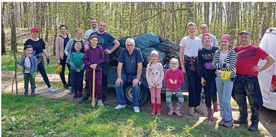
Mieszkańcy Gorzyczek biorący udział w akcji sprzątnięcia