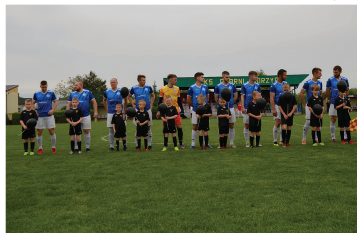
Drużyna Naprzodu Czyżowice przed meczem