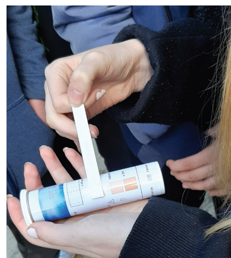
Badanie stężenia wody