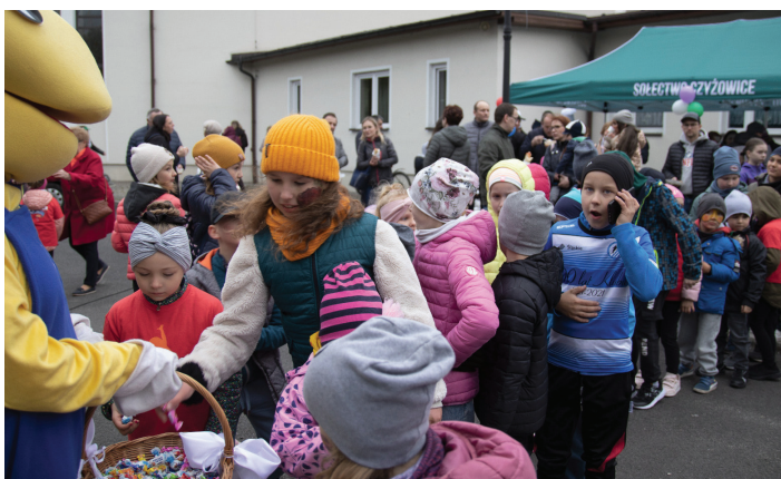
Coś słodkiego dla każdego