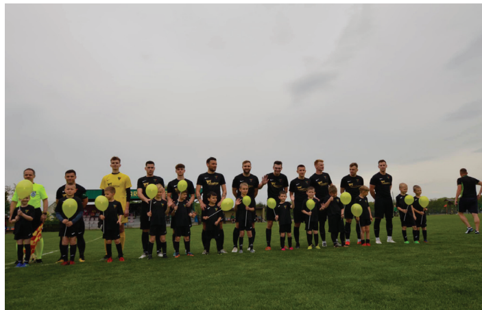
Drużyna Czarnych z Gorzyc przed meczem

Dla przypomnienia, klub z Gorzyc w 2024 będzie obchodzić 100 lecie istnienia