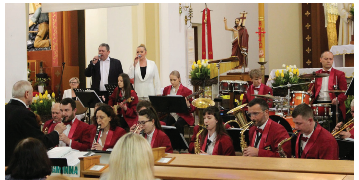
Gminna Orkiestra Dęta z Gołkowic