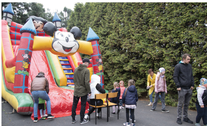
Na ten dzień przygotowano wiele atrakcji dla każdego uczestnika