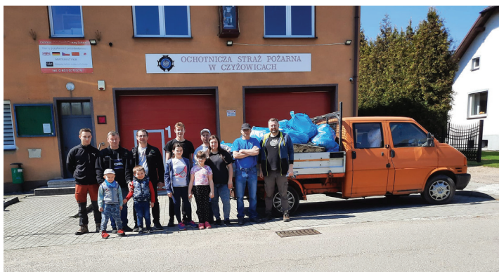
Jedna z grup sprzątających Czyżowice