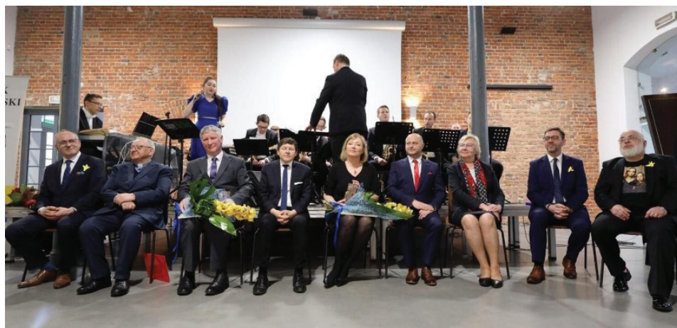
Uczestnicy uroczystej Gali