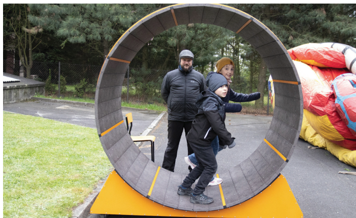
Wiele atrakcji było dostępnych dla najmłodszych tego dnia