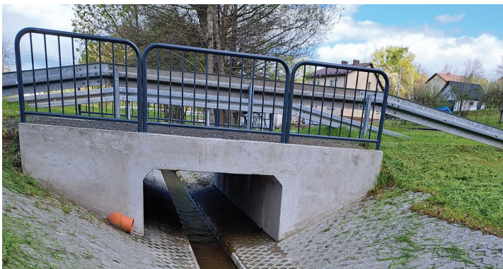
Rogów, jeden ze zmodernizowanych obiektów

Potężna nawałnica przyniosła w maju 2021 r. wiele zniszczeń, najwięcej w Rogowie. Wszystkie szkody zostały zinwentaryzowane przez wójta i urząd gminy. Następnie zostało zlecone wykonanie dokumentacji projektowych; gmina uzyskała stosowne pozwolenia i uzgodnienia (co oczywiście trochę trwało), które pozwoliły na wyczyszczenie lub modernizację kolejnych obiektów oraz cieków. Prace są finansowane wyłącznie ze środków własnych gminy, ponieważ ministerstwo odmówiło wnioskowanego wsparcia. W ramach tych zadań wyczyszczone, zmodernizowane lub odbudowane zostały już m.in.: mostek z przepustem ramowym pod ul. Palarni, wyjście przepustu pod ul. Sportową oraz duży rów na Syryncu, poniżej ul. Wyzwolenia.