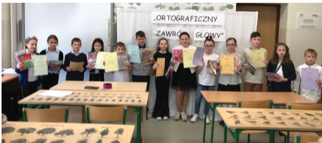
Uczestnicy Gminnego Konkursu Ortograficznego

W kwietniu 2023 r. w Szkole Podstawowej w Bluszczowie odbył się Gminny Konkurs Ortograficzny "Ortograficzny zawrót głowy". Konkurs przeznaczony był dla uczniów klas II-III. Do miana mistrza ortografii Gminy Gorzyce przystąpili uczniowie ze szkół w Rogowie, Gorzycach, Gorzyczkach Czyżowicach i Bluszczowie. Uczestnicy zmierzli się z tekstem o wiosennych porządkach w domu i w ogrodzie. W tekście znalazły się między innymi wyrazy takie, jak: porzeczka, jeżyna, wierzba, krzew, róża, prószyć. Najwięcej trudności sprawiło jednak niezbyt znane uczniom i rzadko używane słowo "hortensja".