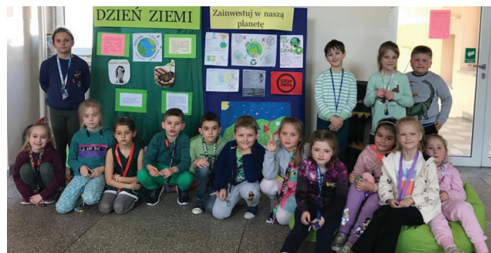
Zielony - kolor Dnia Ziemi