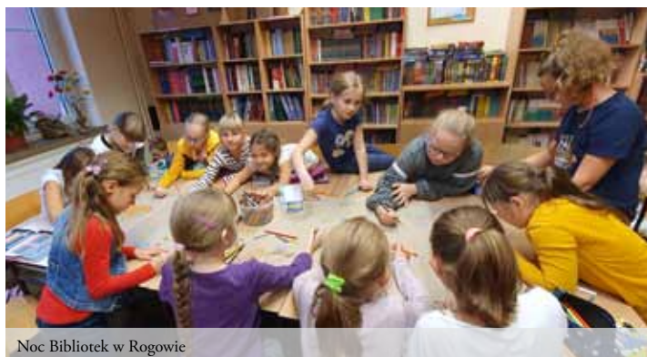
Noc Bibliotek w Rogowie