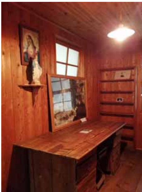
Miejsce pracy o. Kolbego, muzeum Nagasaki