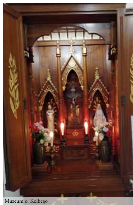
Muzeum o. Kolbego

9 podróży apostolskiej, zakończonej krótką wizytą na Alasce (Stany Zjednoczone Ameryki Północnej). Spotkania z wiernymi podczas mszy św. oraz z młodzieżą poświęcone były rozważaniu znaczenia pokoju w życiu jednostki i społeczeństwa oraz nadziei i miłości. Swoistym apelem o pokój i rozbrojenie było wystąpienie w Hiroszynie. Jan Paweł II powiedział do zebranych: Ci, którym leży na sercu dobro ludzkiego życia, winni wywierać wpływ na rządy i na osoby, które podejmują decyzje gospodarczej i społecznej natury, aby ich działalność była zgodna z wymogami pokoju. Kontynuacją myśli wypowiedzianych pod