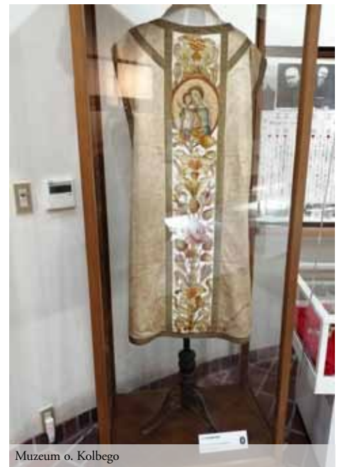
Muzeum o. Kolbego