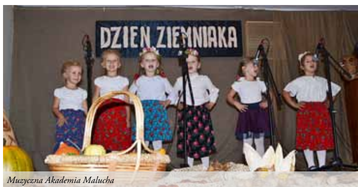
Muzyczna Akademia Malucha