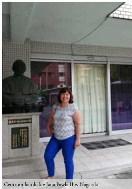
Centrum katolickie Jana Pawła II w Nagasaki