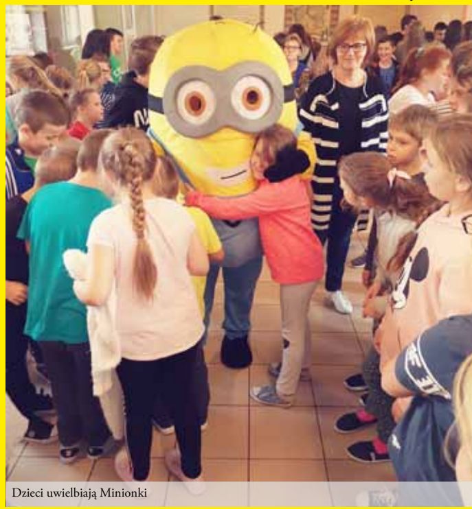
Dzieci uwielbiają Minionki