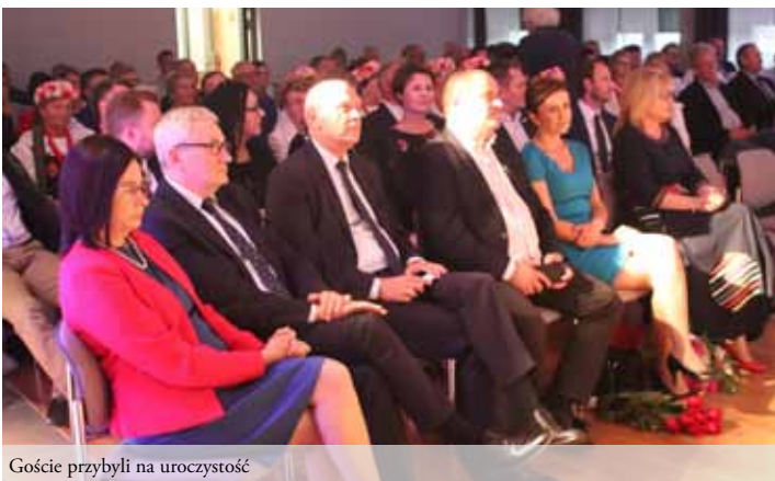
Goście przybyli na uroczystość