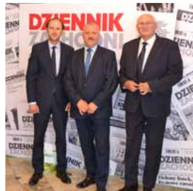
Delegacja sołectwa Gorzyce