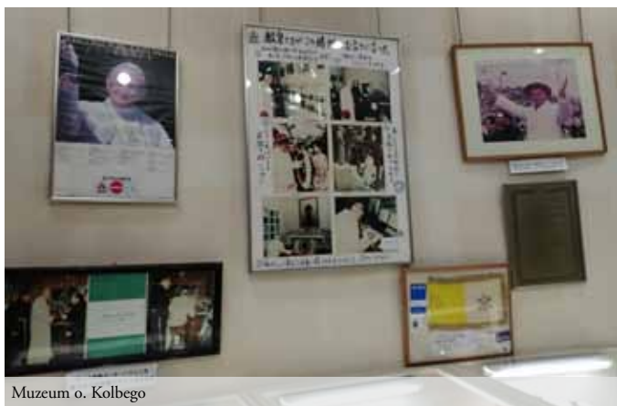
Muzeum o. Kolbego

Jana Pawła II do Japonii, która odbyła się 23-26 lutego 1981. Celem pielgrzymki Papieża Polaka było oddanie czci męczennikom za wiarę, wizytacja lokalnej wspólnoty kościelnej. Japonia była czwartym (po Pakistanie, Filipinach i Guam) krajem odwiedzionym przez Jana Pawła II podczas