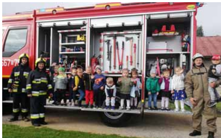
Turscy strażacy z przedszkolakami

Realizując zalecenia MEN, w sprawie realizacji zadań dotyczących doradztwa zawodowego w ramach preorientacji zawodowej, a także promując ideę integracji społecznej, gościmy cyklicznie w naszym przedszkolu przedstawicieli różnych zawodów. Tym razem zaszczylicili nas swoją obecnością odważni Strażacy Ochotniczej Straży Pożarnej w Turzy Śląskiej. Podczas spotkania nasi Goście ubrani w mundury strażackie, zapoznali dzieci z tajnikami trudnej, niebezpiecznej i niezwykle odpowiedzialnej pracy Strażaków. Zaprezentowali nam swój wóz strażacki, przy którym zrobiliśmy sobie piękne zdjęcia pamiątkowe. Przebrani w mundury strażackie, będące przedmiotem marzeń małych chłopców, przeprowadzili próbę gaszenia "pożaru", z wykorzystaniem piany gaśniczej. Przedszkolaki z naszego przedszkola były zachwycone pokazem oraz bardzo dziękują strażakom za możliwość uczestniczenia w tym pokazie.