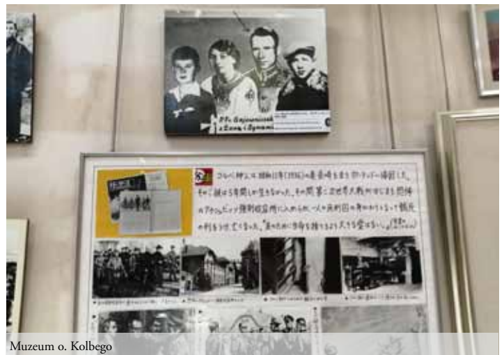
Muzeum o. Kolbego