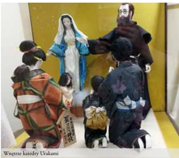
Wnętrze katedry Urakami

pomnikiem było przemówienie wygłoszone podczas spotkania z przedstawicielami świata nauki. Papież podkreślił, że czas, by świat nauki zrozumiał, iż przyszłość planety zależy od wyborów moralnych. Jan Paweł II spotkał się również z Polakami mieszkającymi w Japonii, odwiedził dom św. o. Maksymiliana Kolbe, który przybył do Japonii w 1930 r. W miejscu tym dokonał zawierzenia Niepokalanej Kościoła w Japonii. Modlił się na Wzgórzu Męczenników z Nagasaki, w miejscu, gdzie zostali oni ukrzyżowani 5 II 1597. 3