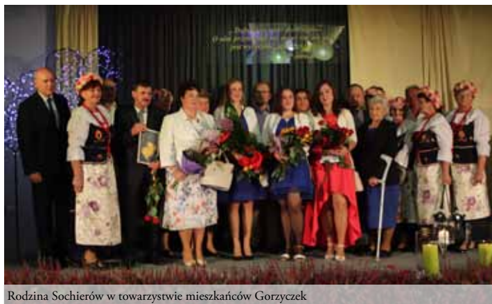
Rodzina Sochierów w towarzystwie mieszkańców Gorzyczek