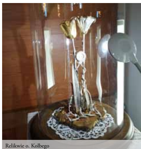
Relikwie o. Kolbego

9 podróży apostolskiej, zakończonej krótką wizytą na Alasce (Stany Zjednoczone Ameryki Północnej). Spotkania z wiernymi podczas mszy św. oraz z młodzieżą poświęcone były rozważaniu znaczenia pokoju w życiu jednostki i społeczeństwa oraz nadziei i miłości. Swoistym apelem o pokój i rozbrojenie było wystąpienie w Hiroszynie. Jan Paweł II powiedział do zebranych: Ci, którym leży na sercu dobro ludzkiego życia, winni wywierać wpływ na rządy i na osoby, które podejmują decyzje gospodarczej i społecznej natury, aby ich działalność była zgodna z wymogami pokoju. Kontynuacją myśli wypowiedzianych pod