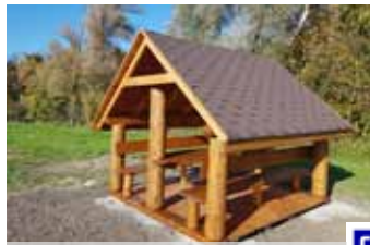
Nowo powstałe miejsca odpoczynku

urządzenie do pomiaru liczby turystów. 19 października na starym przejściu granicznym w Chałupkach odbyło się podsumowanie projektu w którym udział brali partnerzy oraz chętni mieszkańcy przygranicza. Dzięki temu teren wokół Nautici nabrał nowych walorów krajobrazowych. Przypominamy iż, projekt realizowany jest w partnerstwie. Partnerami projektu są zarówno Polacy jak i Czesi tj Gmina Mszana, Gmina Gorzyce, Gmina Krzyżanowice z Polski oraz Miasto Bohumin i Miasto Ostrava z Czech. Apelujemy również: dbajmy wszyscy o nowe atrakcje w Gminie i nie zaśmiecajmy terenu wokół nich.