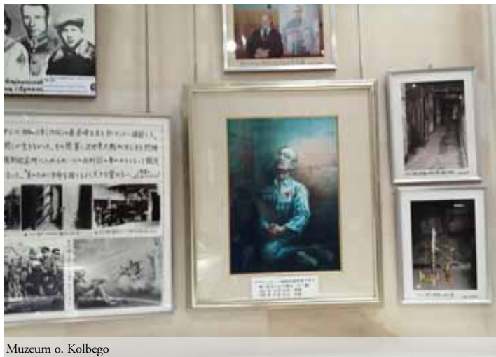
Muzeum o. Kolbego

W Nagasaki pielgrzymi odwiedzili również Katolickie Centrum Jana Pawła II, gdzie zatrzymują się wszystkie pielgrzymki odwiedzające Nagasaki. W tym miejscu zebrani wspominali pielgrzymkę świętego