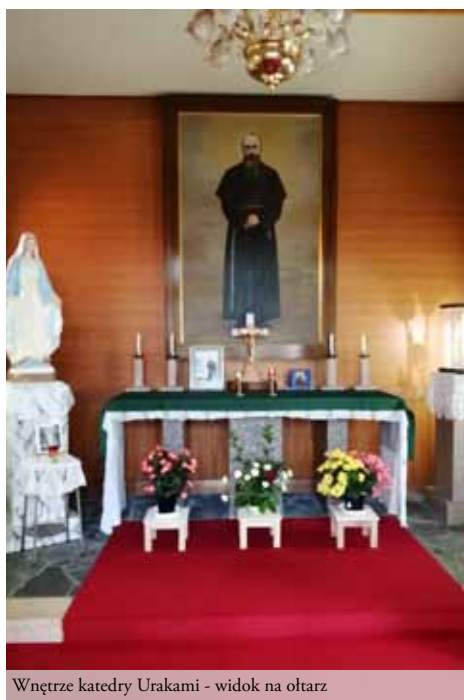
Wnętrze katedry Urakami - widok na ołtarz