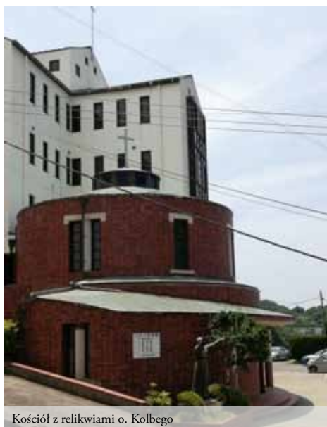
Kościół z relikwiami o. Kolbego