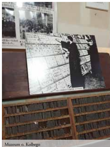
Muzeum o. Kolbego

pomnikiem było przemówienie wygłoszone podczas spotkania z przedstawicielami świata nauki. Papież podkreślił, że czas, by świat nauki zrozumiał, iż przyszłość planety zależy od wyborów moralnych. Jan Paweł II spotkał się również z Polakami mieszkającymi w Japonii, odwiedził dom św. o. Maksymiliana Kolbe, który przybył do Japonii w 1930 r. W miejscu tym dokonał zawierzenia Niepokalanej Kościoła w Japonii. Modlił się na Wzgórzu Męczenników z Nagasaki, w miejscu, gdzie zostali oni ukrzyżowani 5 II 1597. 3