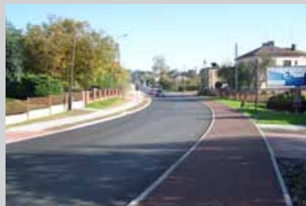
Droga po remoncie

Na placu zabaw w Osinach zostały zabudowane 4 urządzenia do gimnastyki plenerowej i dwa urządzenia zabawowe realizujące projekt z 2018 roku.