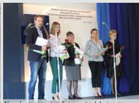
Nagrodzeni pracownicy administracji i obsługi