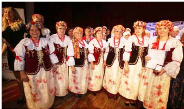
KGW z Czyżowic

Na uczestników gali finałowej czekała miła niespodzianka, przygotowana przez KGW powiatu kłobuckiego w postaci wiejskich