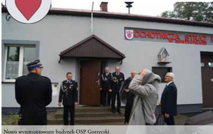
Nowo wyremontowany budynek OSP Gorzycki