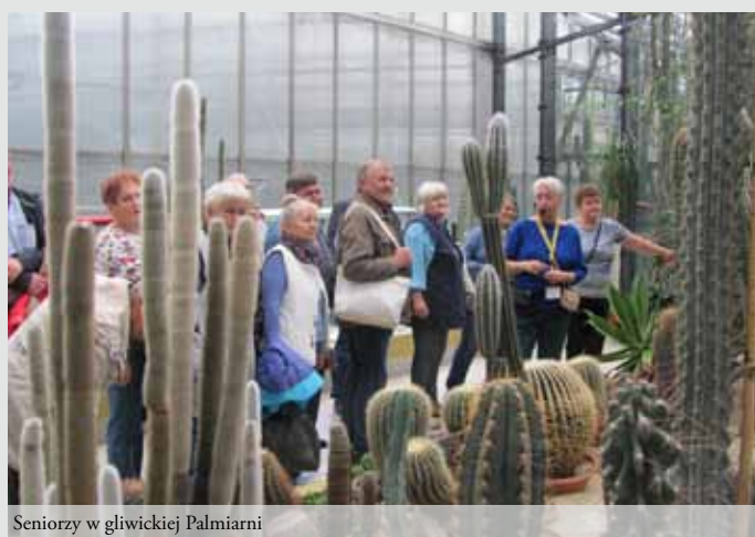
Seniorzy w gliwickiej Palmiarni

25 września 2019 r., grupa 100. osób - członków Stowarzyszenia Emerytów i Rencistów Senior w Gorzyczach zakończyła sezon letni w Palmiarni w Gliwicach, a później podsumowanie imprezy nastąpiło na biesiadzie w restauracji Rajska Zakątek w Knurowie.