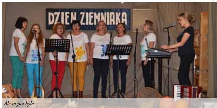
Ale to już było

Pyra, kartofel, brambor, grula. Ziemniak niejedno ma imię. Czy wyobrażacie sobie życie bez niego? Jakie ziemniaczane potrawy lubicie? Można zadawać wiele pytań, ale nie o to nam chodzi.