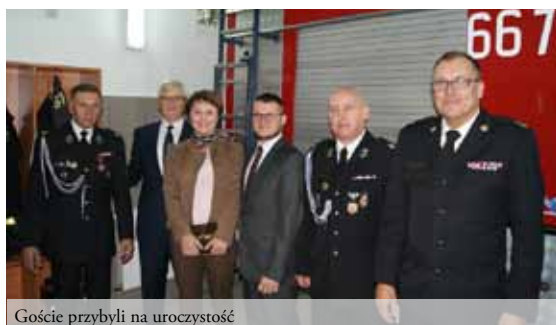
Goście przybyli na uroczystość