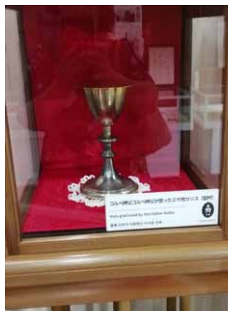
Muzeum o. Kolbego

Jana Pawła II do Japonii, która odbyła się 23-26 lutego 1981. Celem pielgrzymki Papieża Polaka było oddanie czci męczennikom za wiarę, wizytacja lokalnej wspólnoty kościelnej. Japonia była czwartym (po Pakistanie, Filipinach i Guam) krajem odwiedzionym przez Jana Pawła II podczas