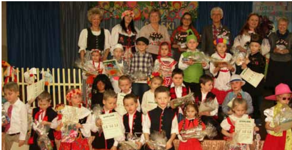
Uczestnicy konkursu z organizatorami i członkami jury