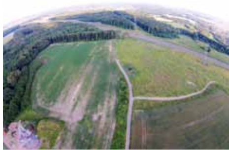
Działki na strefie w Gorzyczkach

Gmina Gorzyce oferuje do sprzedaży grunty inwestycyjne położone w Gorzyczkach, w pobliżu węzła autostrady A1, przy granicy z Republiką Czeską.