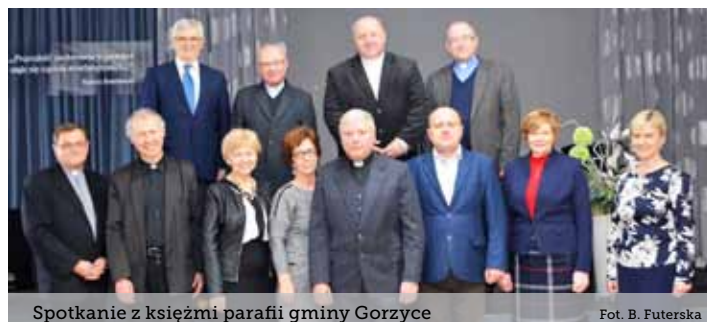
Spotkanie z księżmi parafii gminy Gorzyce