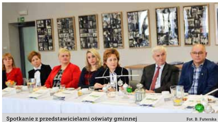
Spotkanie z przedstawicielami oświaty gminnej