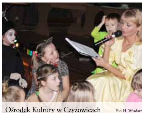
Ośrodek Kultury w Czyżowicach