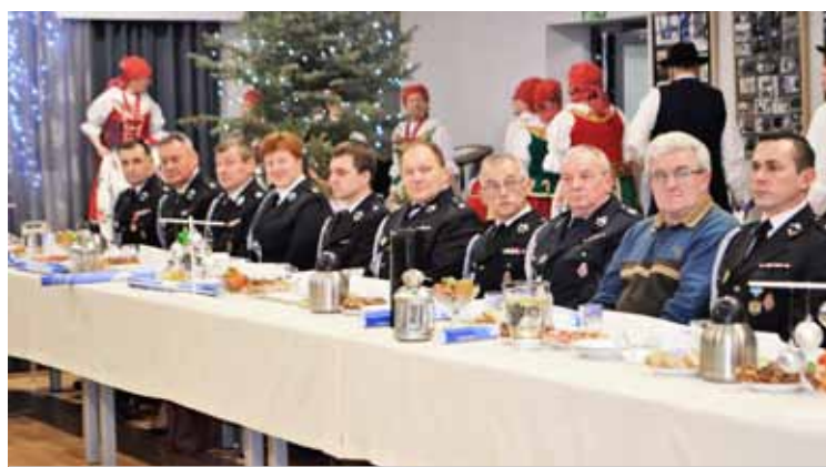
Spotkanie z przedstawicielami OSP i Zarządu Gminnego OSP RP