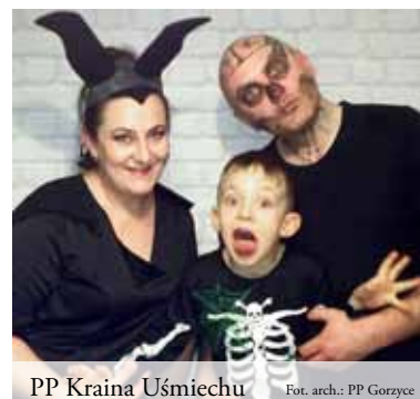
PP Kraina Uśmiechu