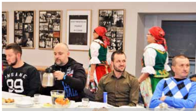
Spotkanie z działaczami sportowymi