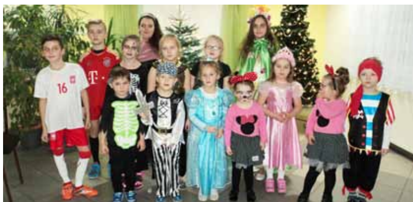
Świetlica Wiejska w Uchylsku