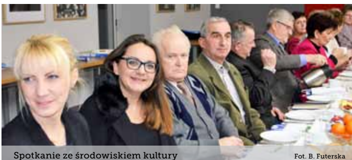
Spotkanie ze środowiskiem kultury