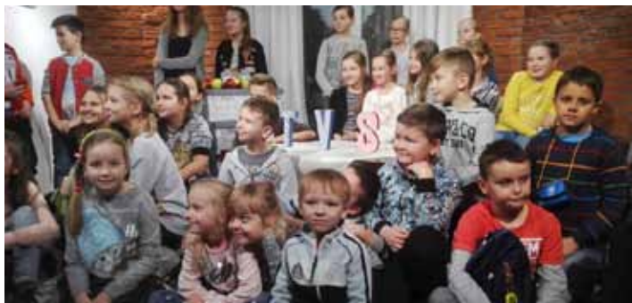
W siedzibie TVS