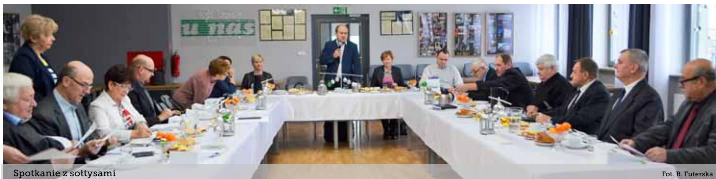
Spotkanie z sołtysami