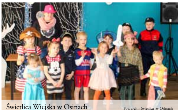
Świetlica Wiejska w Osinach