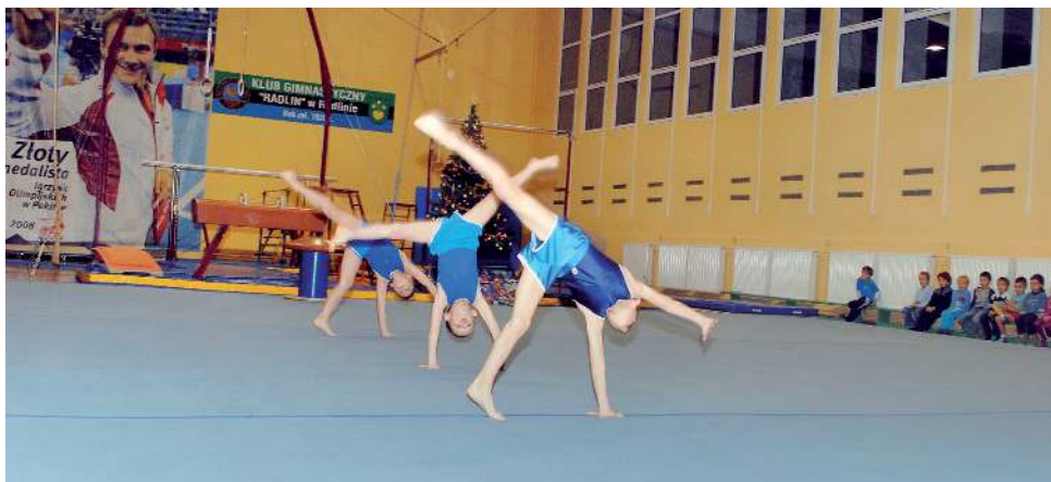
Pokazy umiejętności młodych gimnastyków.