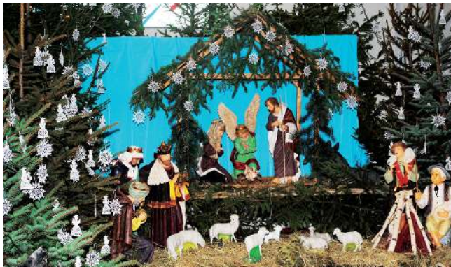
Stajenka w Czyżowicach.