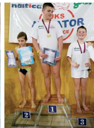
Wyniki z zawodów znajdują państwo na str. 21.