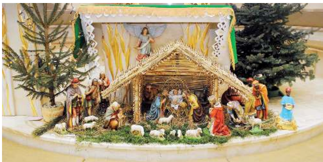
Stajenka w Osinach.

O tradycyjnych stajenkach przeczytasz więcej na s. 3