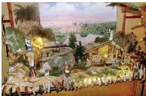
Stajenka prywatna w domu państwa Paloc w Gorzycach.