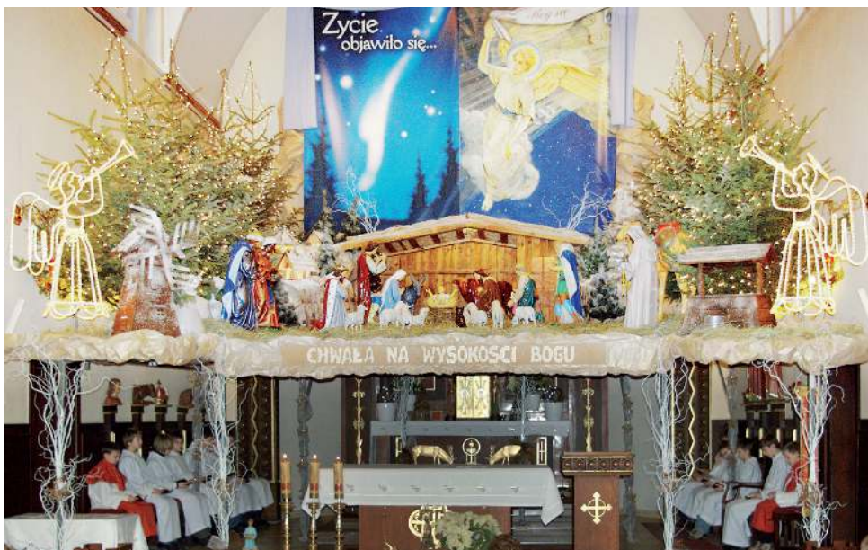
Stajenka w Olzie.