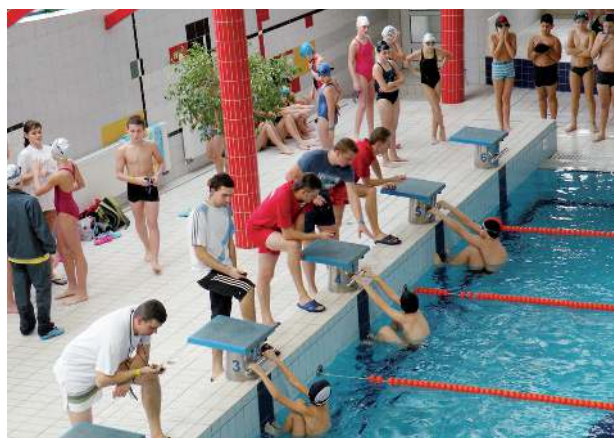
VIII zawody pływackie w „Nautice” odbyły się 12 grudnia 2011 r.