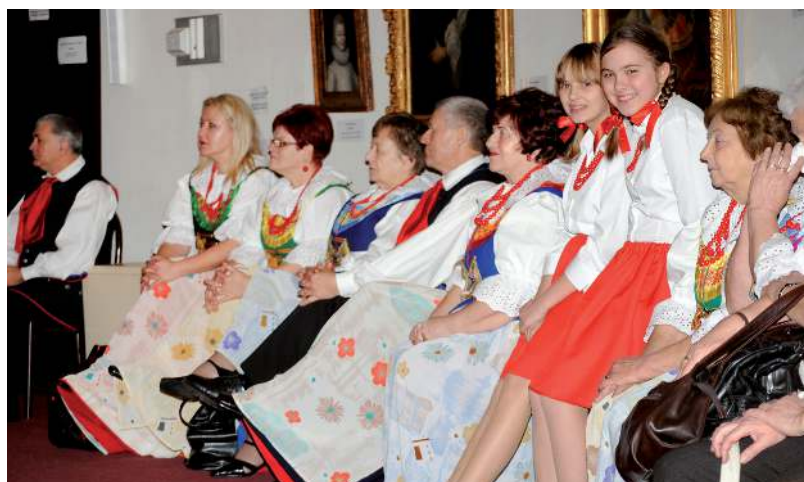
Doświadczenie procentuje. Idzie młodość. Dziewczyny wypadły znakomicie. Uśmiechy na twarzach mówią same za siebie.