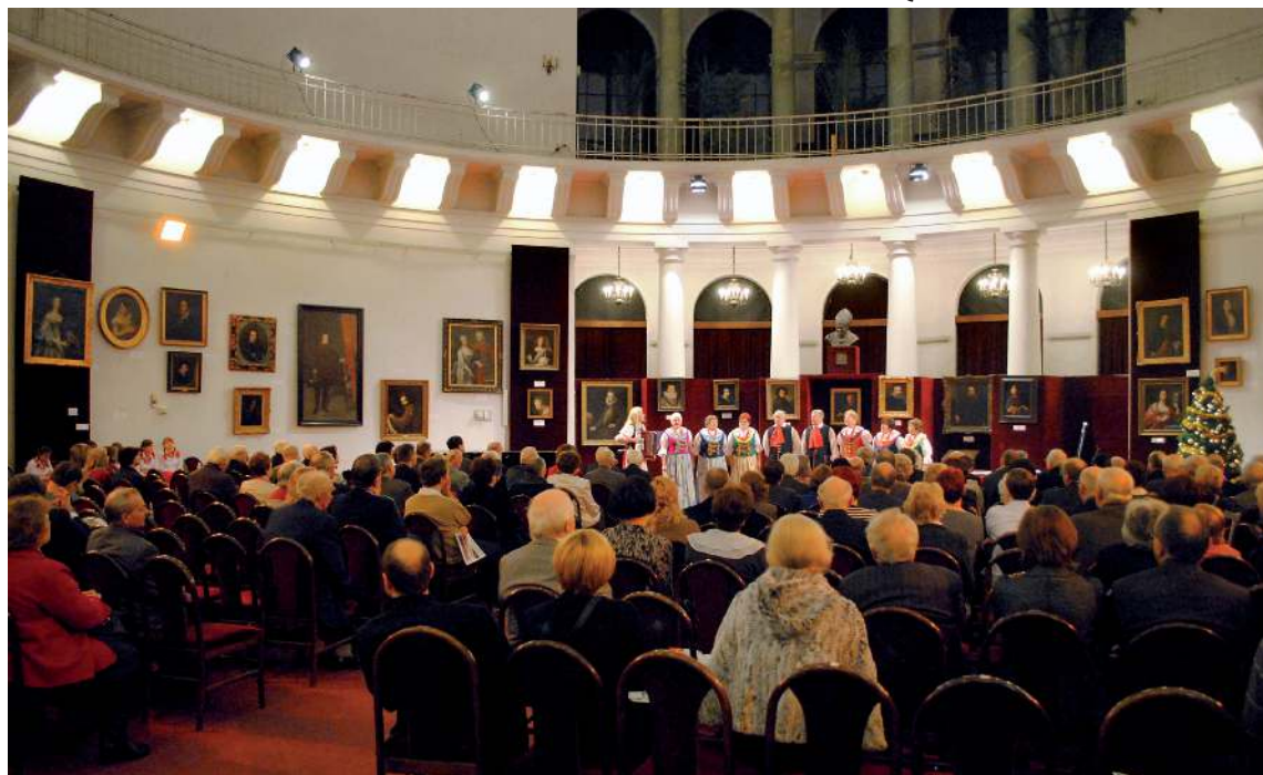
Olzanki zaczarowały warszawską publiczność. Widownię wypełnili ludzie nauki, kultury i sztuki. Ślązacy – Warszawiacy.