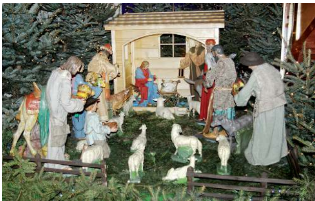
Stajenka w Rogowie.