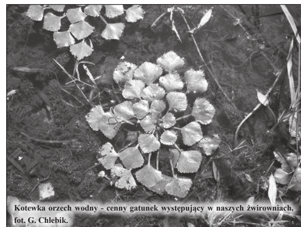
Kotewka orzech wodny - cenny gatunek występujący w naszych zwirowniach, fot. G. Chlebiak.