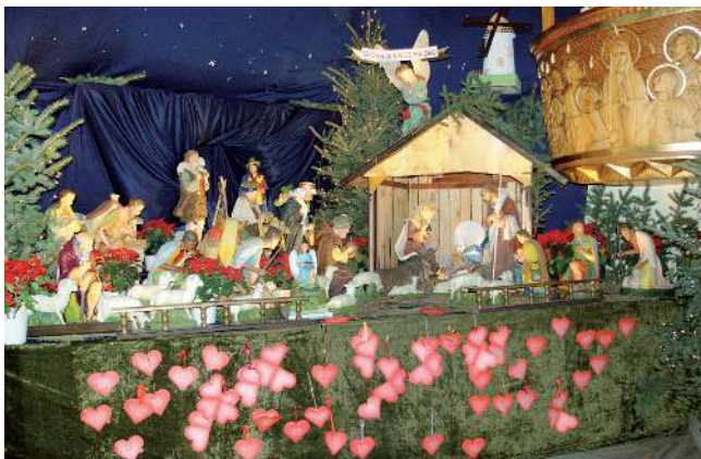
Stajenka w Turzy Śl.