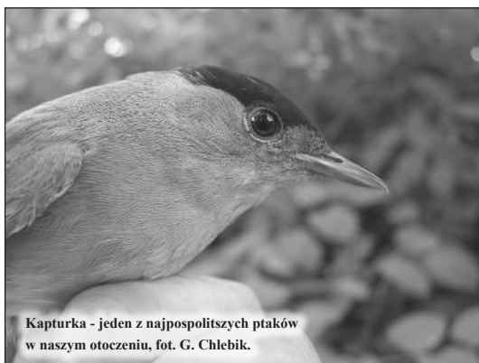
Kapturka - jeden z najpospolitszych ptaków w naszym otoczeniu, fot. G. Chlebiak.

Dawno, dawno temu, na łamach naszej gazety, przedstawiłem Państwu szereg krótkich artykułów popularyzujących przyrodę naszego regionu. Były wśród nich przemyslenia dotyczące m.in. ewolucji krajobrazu, potrzeb retencjonowania wody, a także zasobów przyrodniczych (ptaków i roślin). Od tego czasu wiele się zmieniło, zarówno w kwestii samej wiedzy o tych zagadnieniach, ale także metod, którymi je badamy. Poczuję się w obowiązku, aby przedstawić szerszemu gronu Czytelników relację z tego, czego dokonano w ostatnim dziesięcioleciu w temacie poznania przyrody naszej gminy i okolic.