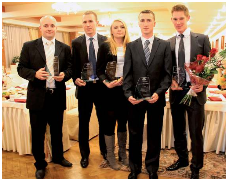
Nagrodzeni sportowcy z gminy Gorzyce.