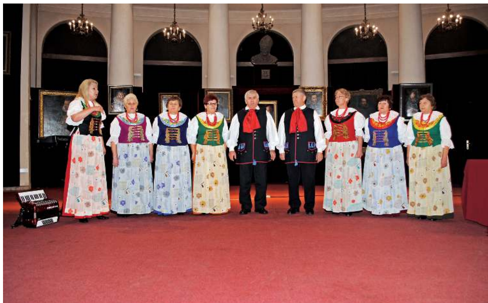
Co dalej? Bruksela, a może Carnegie Hall?