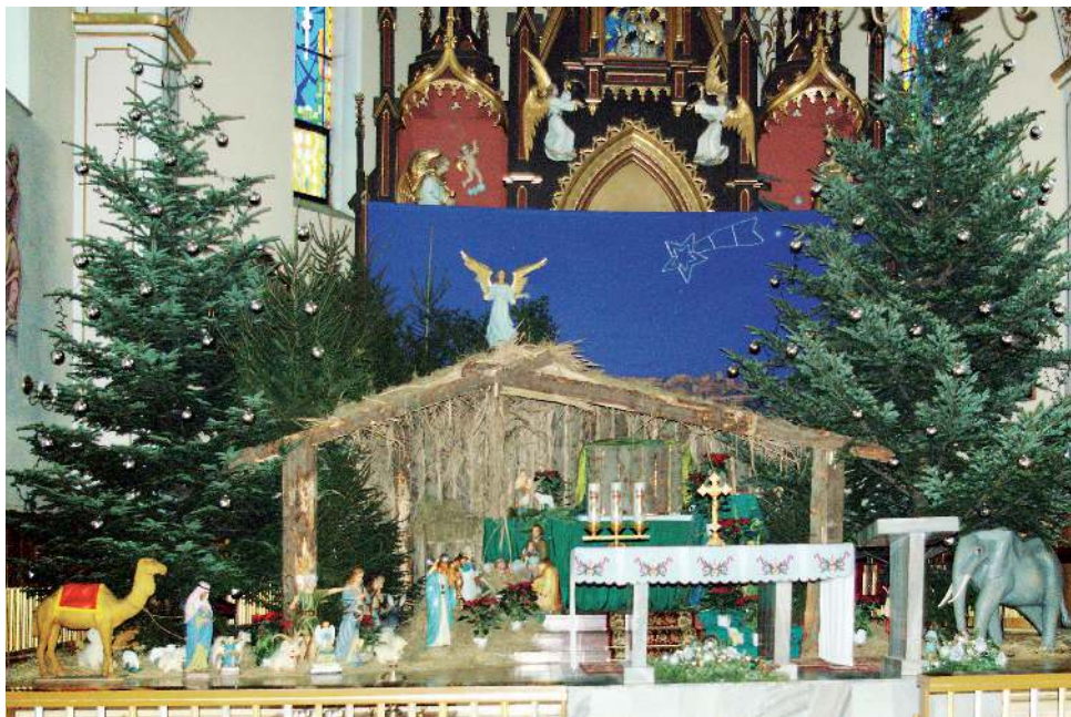
Stajenka w Gorzycach.