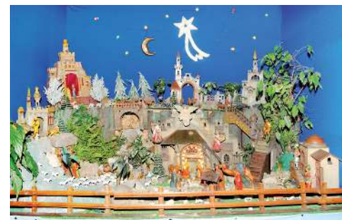
Stajenka prywatna w domu państwa Kretek w Gorzycach.