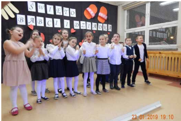
Mali artyści, którzy przygotowali dla dziadków atrakcje