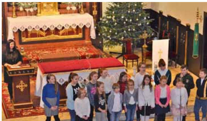
Uczniowie SP w Olzie