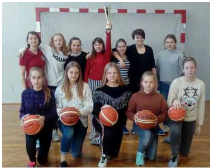
Turska drużyna koszykarska dziewcząt