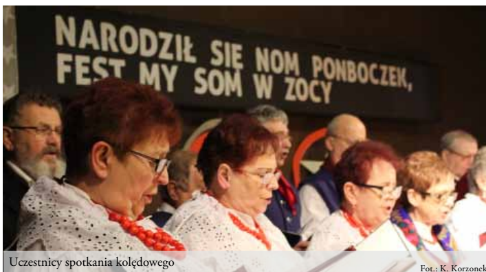
Uczestnicy spotkania kolędowego