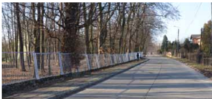
Ulica Zamkowa w Gorzycach

Olza. Gmina realizuje również inwestycję kanalizacyjną w Olzie przy ul. Dworcowej. Powstanie tu 656 m kanalizacji. Planujemy zakończenie realizacji zadania do 30.09.2019 r.