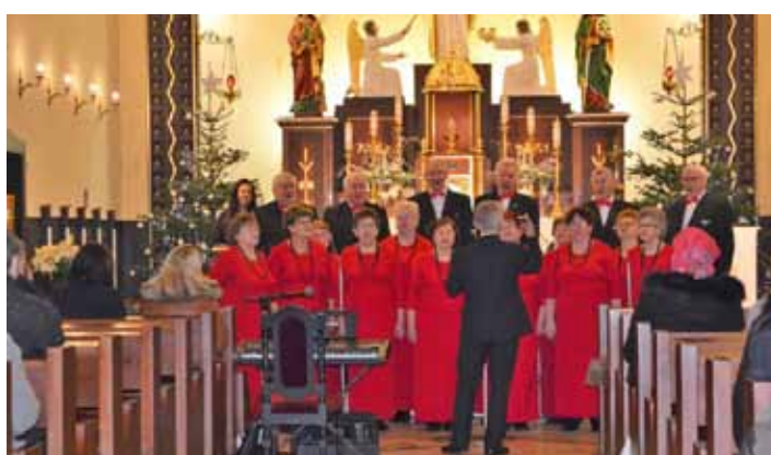
Chór Słowiki nad Olzą