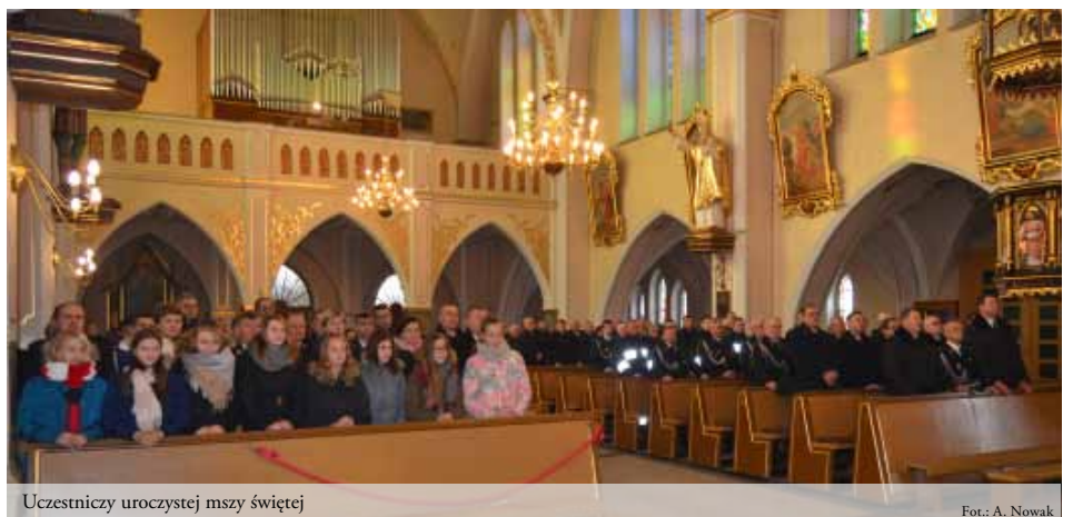
Uczestnicy uroczystej mszy świętej