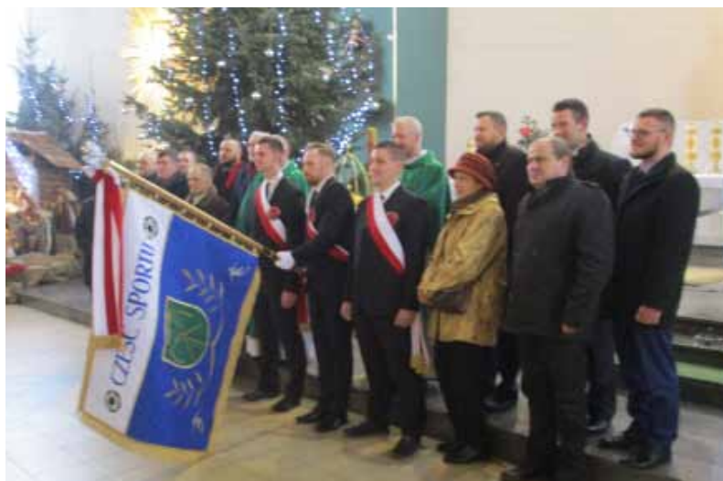
Uroczyste poświęcenie nowego sztandaru LKS Naprzód Czyżowice