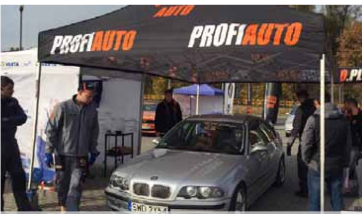
Eksperci z MROAUTO.pl podczas pracy