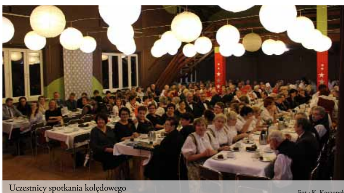
Uczestnicy spotkania kolędowego