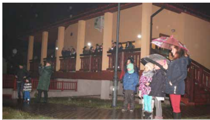
Mimo deszczowej pogody frekwencja dopisała