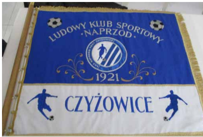
Sztandar LKS Naprzód Czyżowice