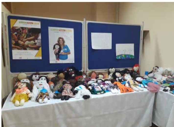
Efekt zajęć edukacyjnych w SP w Rogowie