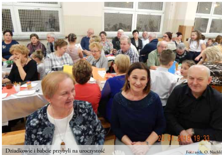
Dziadkowie i babcie przybyli na uroczystość