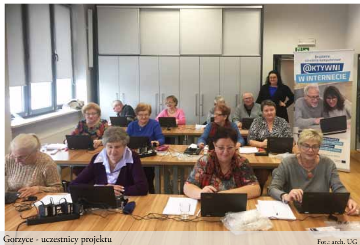
Gorzyce - uczestnicy projektu