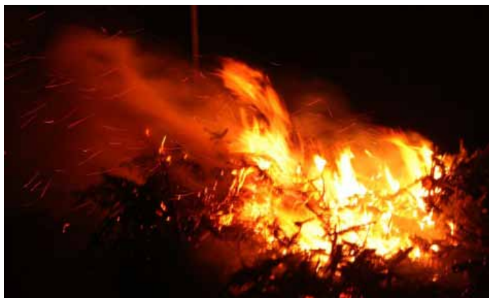
Pałące się choinki