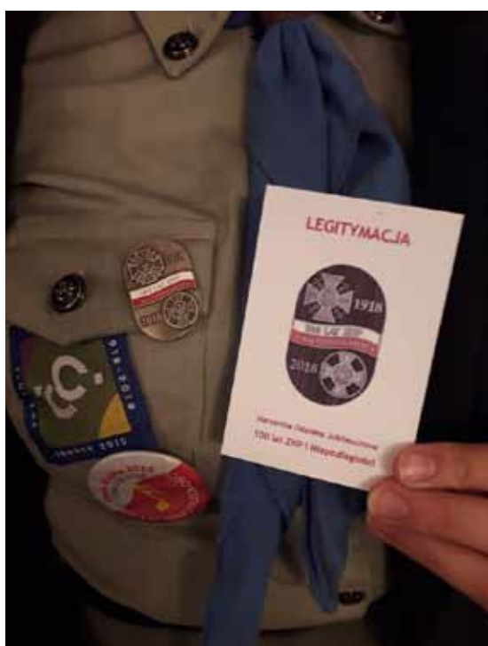
Jubileuszowa odznaka i legitymacja członków 2 DH z Olzy