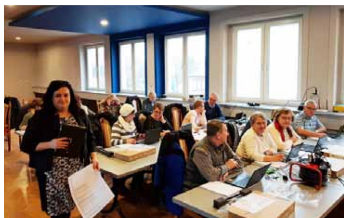
Rogów- uczestnicy projektu