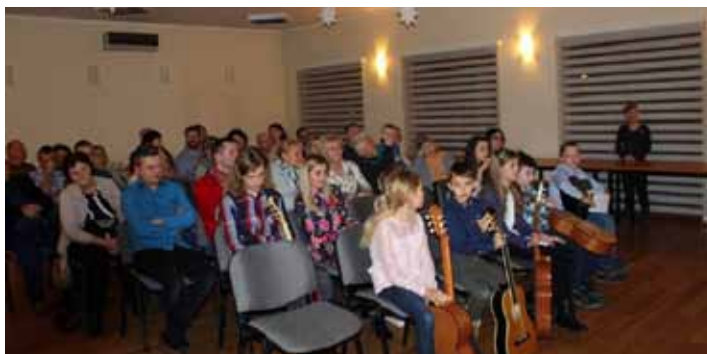
Uczestnicy popisu gitarowego