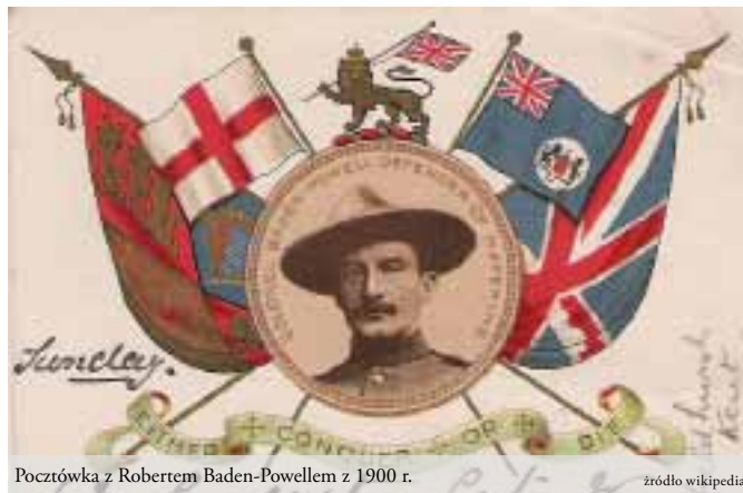
Pocztówka z Robertem Baden-Powellem z 1900 r.