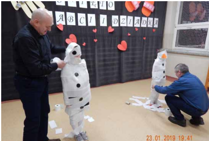
Dziadkowie chętnie brali udział w zabawach