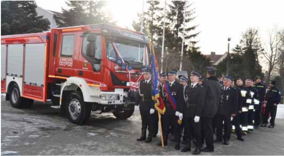
Uroczyste poświęcenie nowego wozu bojowego OSP Gorzyce