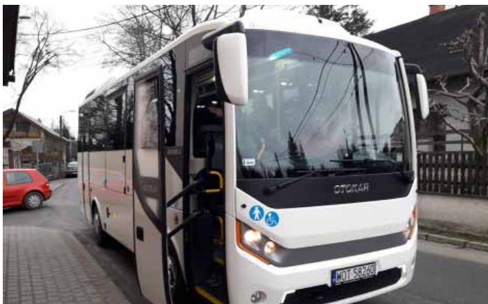
Nowy gminny autobus szkolny, sprowadzony dla naszych dzieci i młodzieży