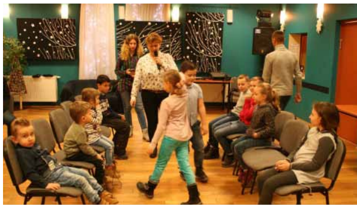
Były też zabawy dla najmłodszych