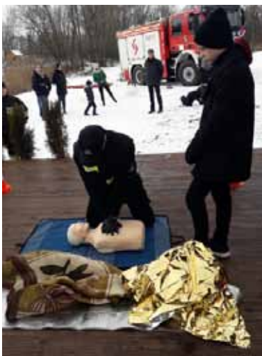
Kurs pierwszej pomocy