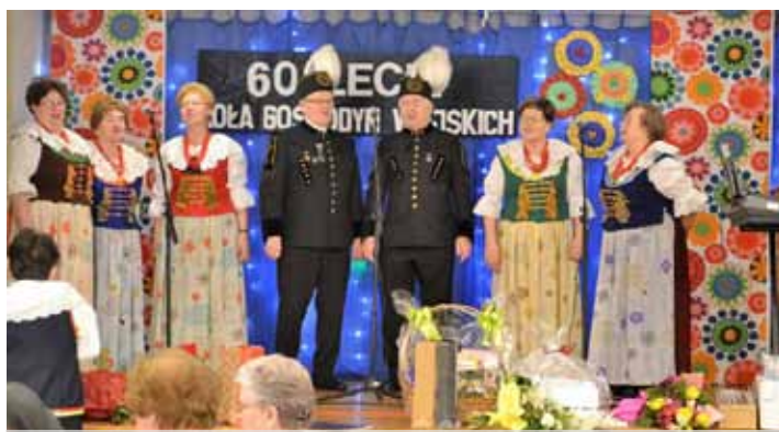
Zespół Olzanki podczas występu dedykowanego jubilatkom i gościom