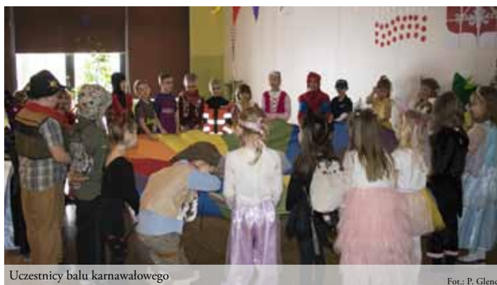
Uczestnicy balu karnawałowego