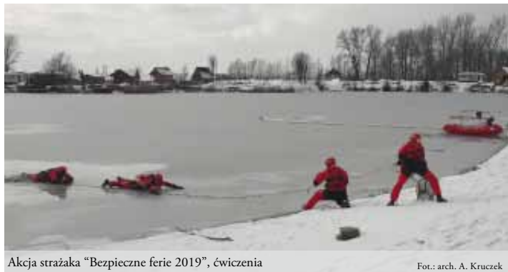
Akcja strażaka „Bezpieczne ferie 2019”, ćwiczenia