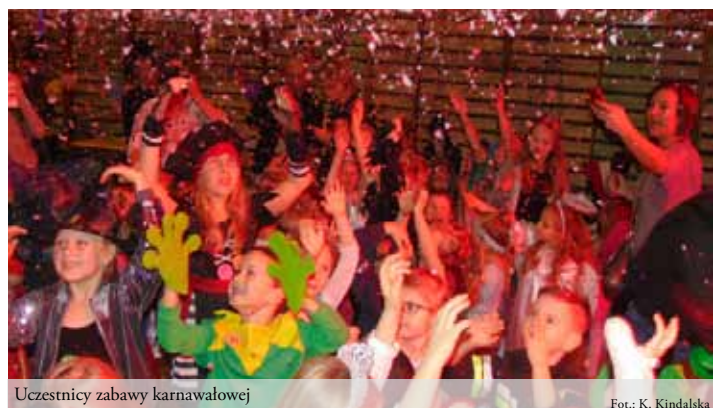
Uczestnicy zabawy karnawałowej