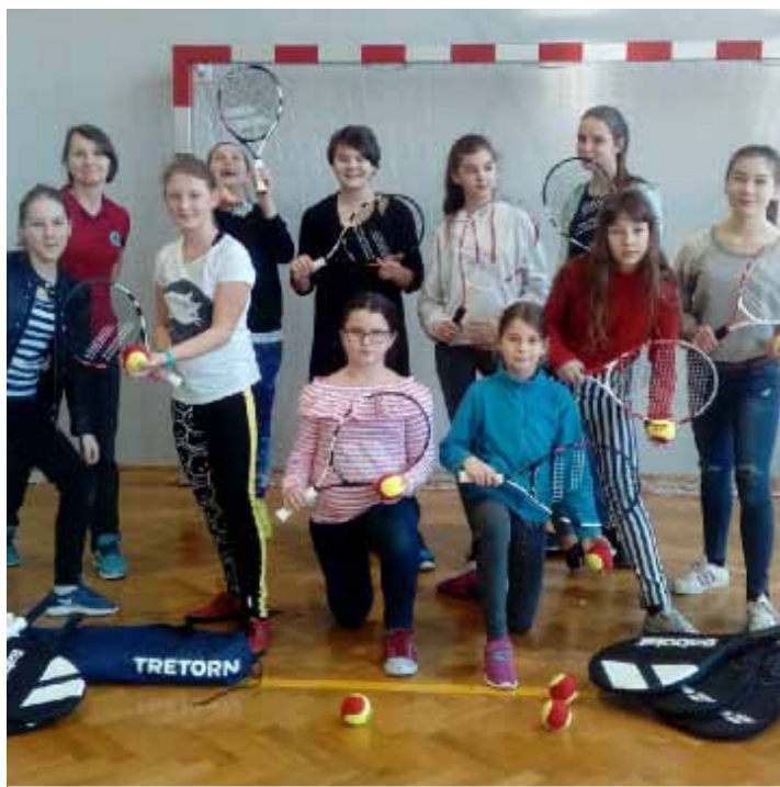
Uczesnicy akcji „Dzieciaki do raket”