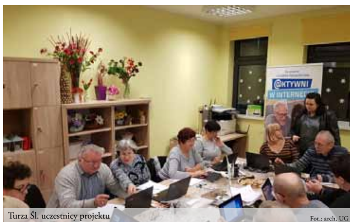
Turza Śl. uczestnicy projektu

Urząd Gminy Gorzyce Referat Strategii i Funduszy Zewnętrznych