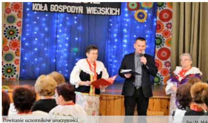
Powitanie uczestników uroczystości