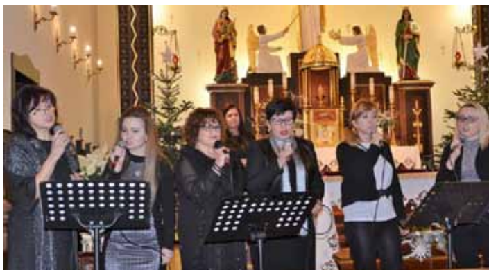
Zespół wokalny Ale to już było