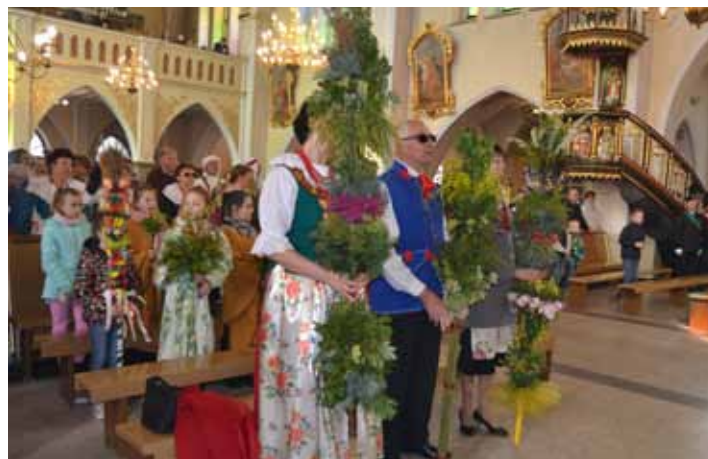
Palmy wykonane przez sołectwa parafii gorzyckiej