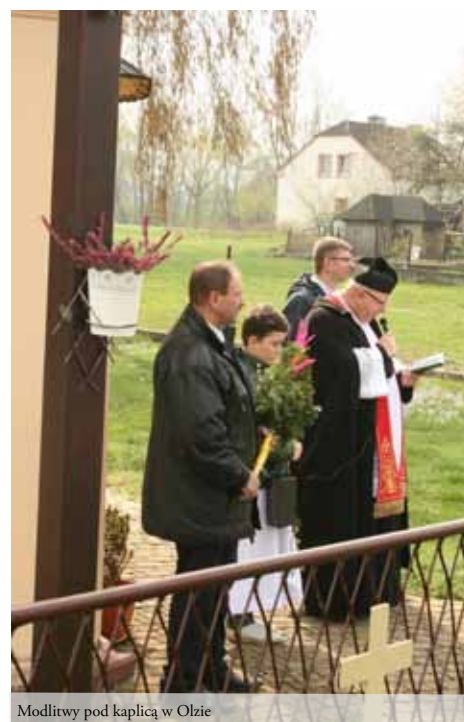
Modlitwy pod kaplicą w Olzie