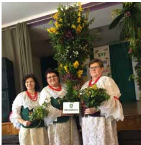
Palma Wielkanocna z sołectwa Belsznica