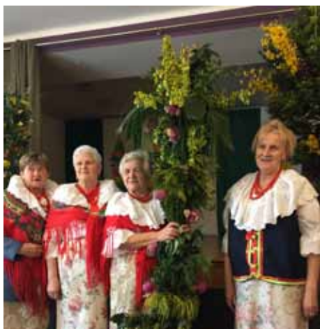
Palma Wielkanocna z sołectwa Olza