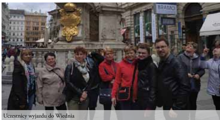
Uczestnicy wyjazdu do Wiednia

6 kwietnia br. o godzinie 10.00 rozpoczęliśmy przygodę w Austrii. Pierwszym punktem wycieczki był piękny pałac Schonbrunn - letnia rezydencja rodziny cesarskiej. To jeden z najpiękniejszych pałaców barokowych w Europie, który jest jednym z najważniejszych zabytków Wiednia oraz dziedzictwem kultury UNESCO. Następnie przejechaliśmy przez Ringstrasse i zobaczyliśmy najciekawsze budowle wokół miasta: Operę Narodową, kanał Dunajski, Schwedenplatz, Plac Marii Teresy, Muzeum Historii, Ratusz, Parlament, Katedrę Św. Szczepana... Przeszliśmy ulicami Graben i Kohlmarkt do pięknego Hofburga. Spacerowaliśmy dziedzińcami rezydencji poprzez historię od gotyku przez renesans do baroku. Wszystkie budowle i pomniki Habsburgów robiły na uczestnikach ogromne wrażenie. Urzekł nas także zakątek Cesarzowej Elżbiety z barokową fontanną. Dużą atrakcją wycieczki był ciekawie zaprojektowany dom komunalny znanego architekta Hundertwassera. Pochodzący z Wiednia wizjoner twierdzi, że człowiek jest tylko gościem natury, stąd też większość jego dzieł ma funkcjonować przede wszystkim w zgodzie z jej zasadami. Zrobiliśmy także świąteczne zakupy na jarmarku i spróbowaliśmy austriackich przysmaków. Wieczorem zmęczeni, lecz nasyceni dużą ilością wrażeń wracaliśmy do domu.