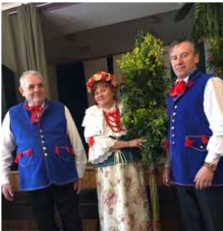
Palma Wielkanocna z sołectwa Kolonia Fryderyk