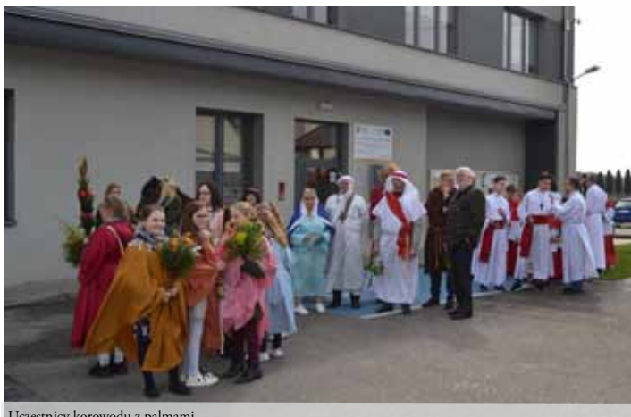
Uczestnicy korowodu z palmami