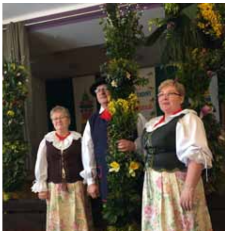
Palma Wielkanocna z sołectwa Rogów