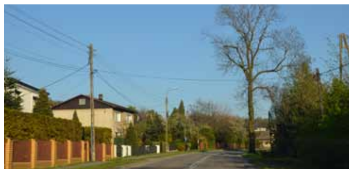
Gorzyce-Osiny, ul. Raciborska

W chwili obecnej kończy się budowa 5 km kanalizacji sanitarnej w sołectwie Turza Śl. Do sieci zostanie przyłączonych około 130 budynków. Do wykonania pozostały prace związane z odtworzeniem nawierzchni na ul. Tysiąclecia. Zadanie było realizowane przez naszą gminę w latach 2018-2019 dzięki pozyskanym środkom zewnętrznym. Trwają prace związane z przygotowaniem przetargu na dalszą kanalizację