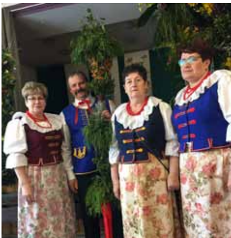
Palma Wielkanocna z sołectwa Turza Śl.