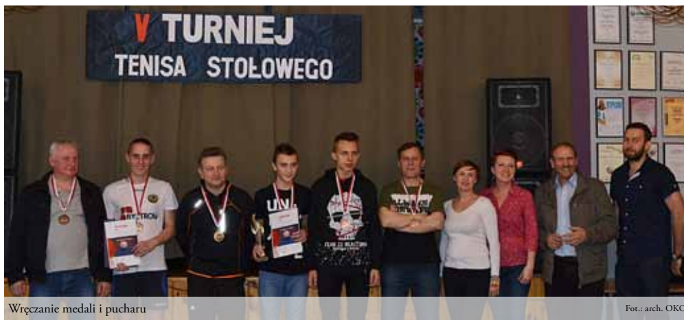
Wręczenie medali i pucharu