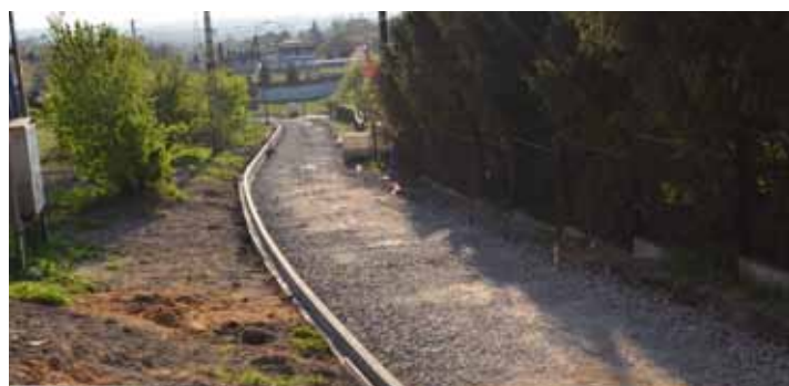
Rogów, ul. Pałarni