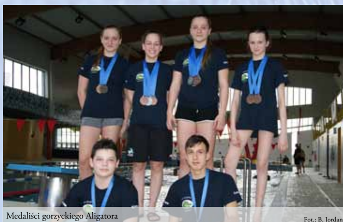
Medaliści gorzyckiego Aligatora