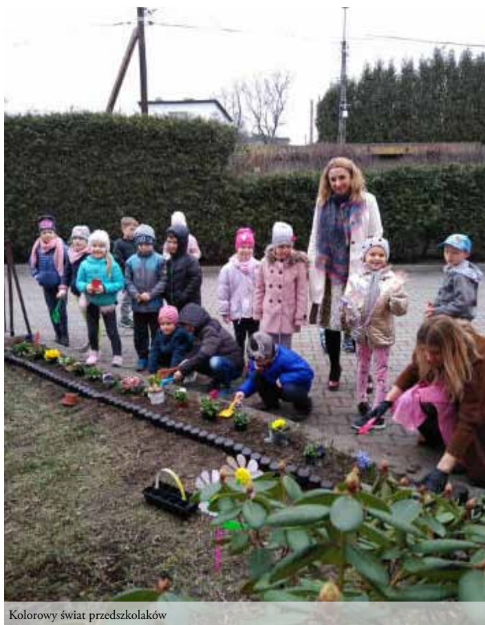
Kolorowy świat przedszkolaków