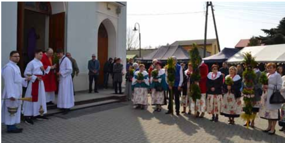
Święcenie palm przed gorzyckim kościołem