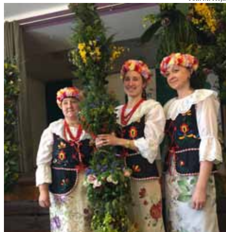
Palma Wielkanocna z sołectwa Gorzyczki