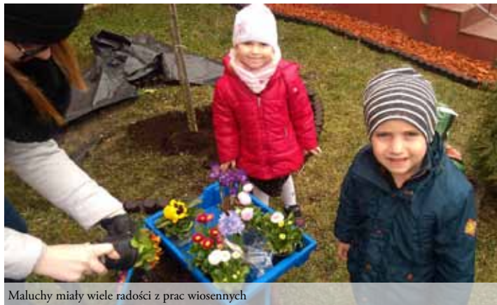
Maluchy miały wiele radości z prac wiosennych