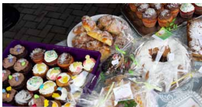
Wypieki sprzedawane na Kiermaszu Wielkanocnym