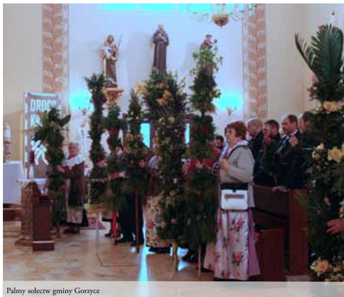
Palmy sołectw gminy Gorzyce