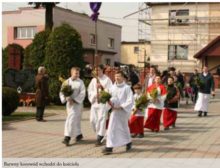
Barwny korowód wchodzi do kościoła