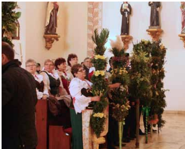
Palmy sołectw gminy Gorzyce