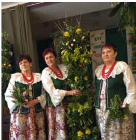
Palma Wielkanocna z sołectwa Odra