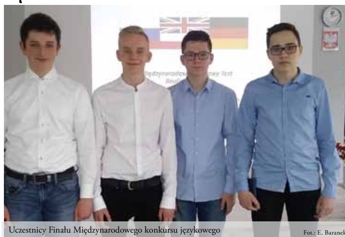
Uczestnicy Finału Międzynarodowego konkursu językowego