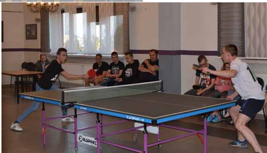
Uczestnicy turnieju podczas gry