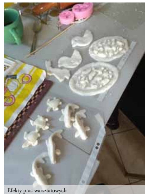
Efekty prac warsztatowych