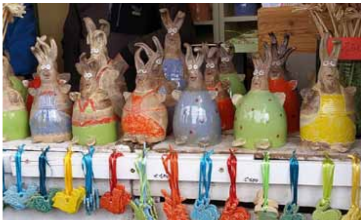
Wiedeński Jarmark Wielkanocny - wyroby ceramiczne