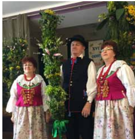
Palma Wielkanocna z sołectwa Bluszczów