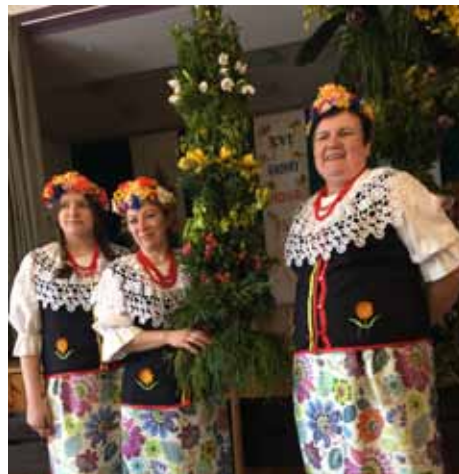
Palma Wielkanocna z sołectwa Uchylisko