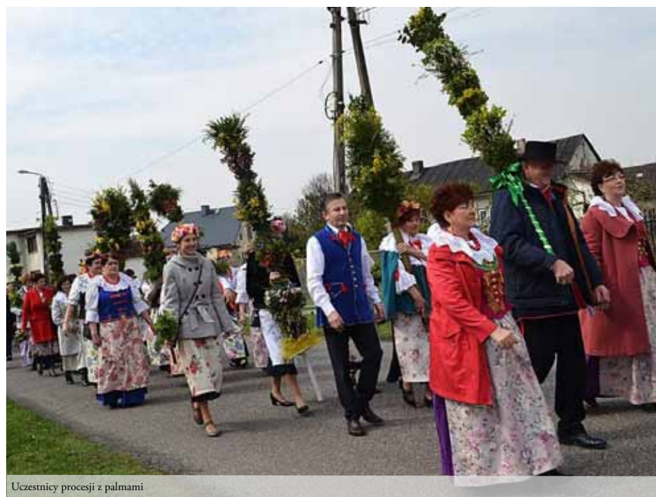
Uczestnicy procesji z palmami