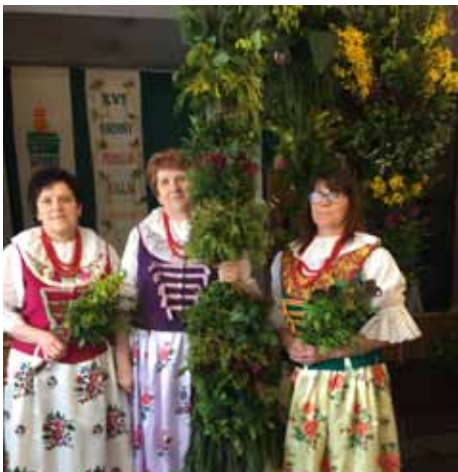
Palma Wielkanocna z sołectwa Gorzyce