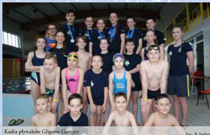
Kadra pływaków Gligator Gorzyce