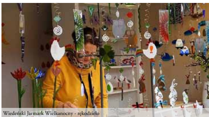
Wiedeński Jarmark Wielkanocny - rękodzieło