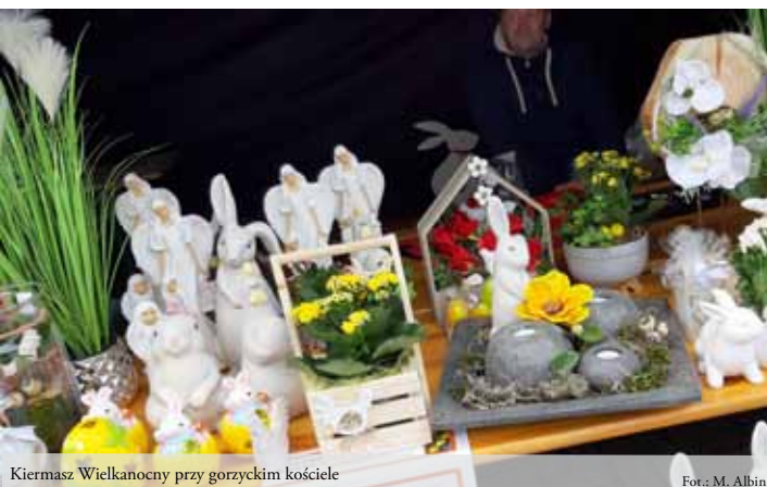
Kiermasz Wielkanocny przy gorzyckim kościele