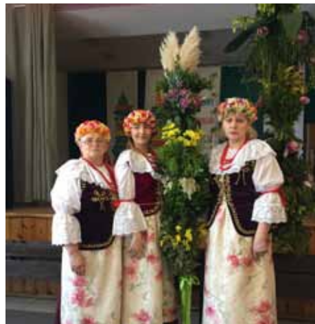
Palma Wielkanocna z sołectwa Czyżowice