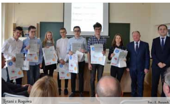
Tytani z Rogowa