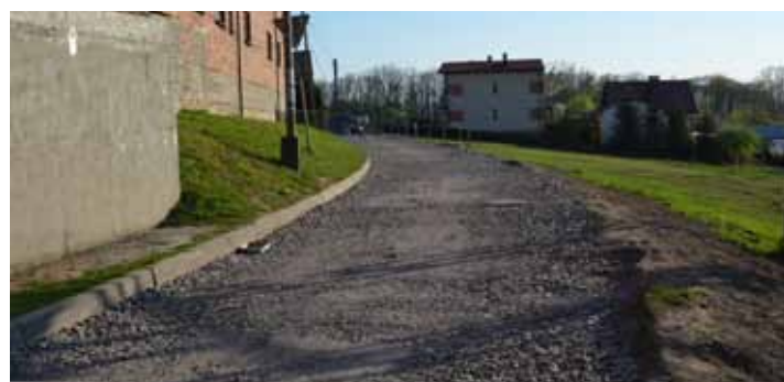
Rogów, ul. Parkowa