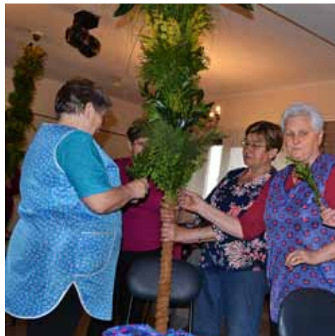
Panie z KGW podczas prac nad palmą wielkanocną