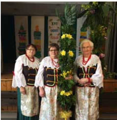
Palma Wielkanocna z sołectwa Osiny