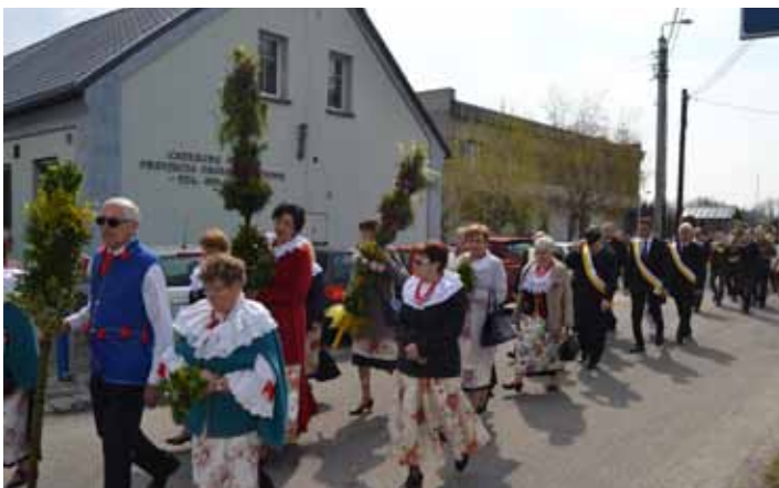
Wymarsz korowodu do gorzyckiego kościoła