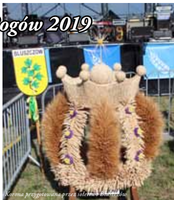
Korona przygotowana przez sołectwo Błogoszczów