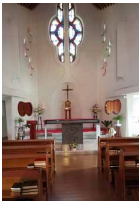
Wnętrze katedry Urakami - widok na ołtarz