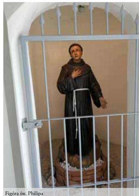
Figura św. Filipa

japońscy chrześcijanie trwali na modlitwie i oczekiwali „kogoś, kto przybędzie z Rzymu”. Autentyczność przybycia miał ostatecznie potwierdzić obrazek „Maria-sama” Matki Bożej.