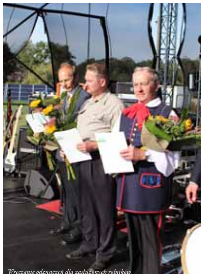
Wzięcie udziału w wręczeniu odznaczeń dla zasłużonych rolników