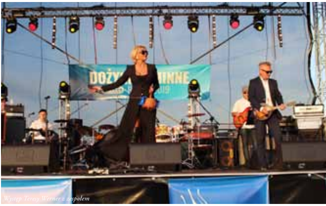
Występ Teresy Werner z zespołem