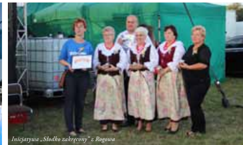
Inicjatywa „Słodko zabęrczony” z Rogowa