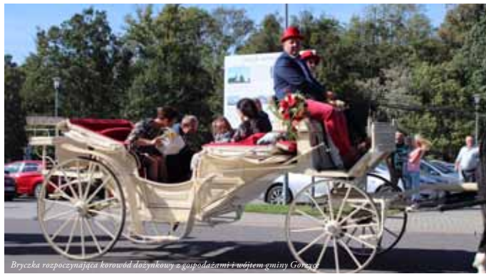
Bryczka rozpoczynająca korowód dożynekowy z gospodyniami i wójtem gminy Gorzów