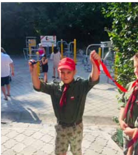
Otwarcie siłowni w Czyżowicach