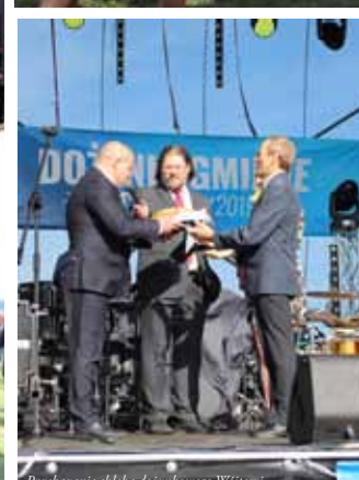
Przekazanie chleba dożynekowego Wójtowni