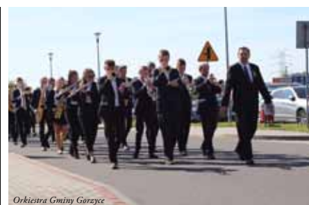
Orkiestra Gminy Górzycze