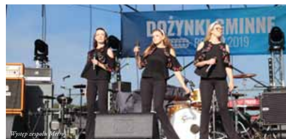
Występ zespołu Metro