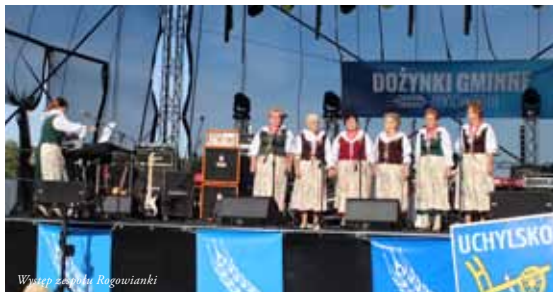
Wstęp zespołu Rogowianki