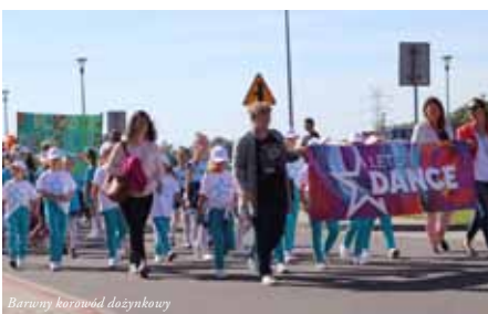
Barwny baranów dożynkowy