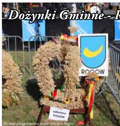
Korona przygotowana przez sołectwo Rogów