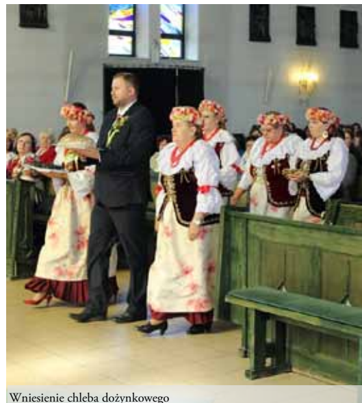
Wniesienie chleba dożynkowego