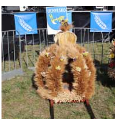
Korona przygotowana przez sołectwo Uchylsko