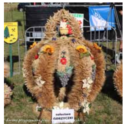
Korona przygotowana przez sekcję Górzyczki