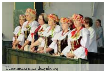
Uczestniczki mszy dożynkowej