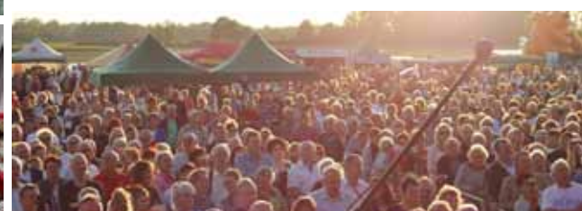
Publiczność podczas występu Teresy Werner