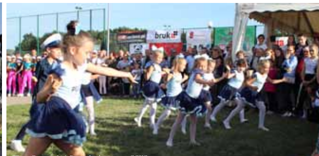
Wstęp Formacji „Leś's Dance” działającej przy GCKG