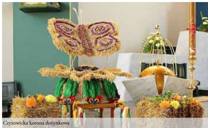
Czyżowicka korona dożynkowa