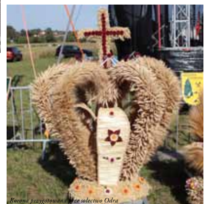
Korona przygotowana przez sekcję Odra