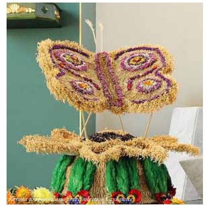
Korona przygotowana przez sekcję Osiny