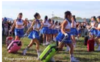
Występ zespołu Riki Tiki