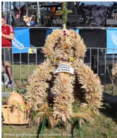
Korona przygotowana przez sołectwo Turza Śl.