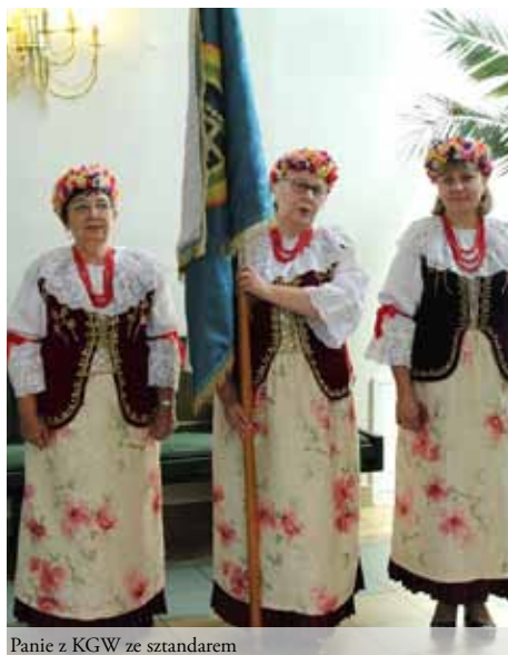
Panie z KGW ze sztandarem