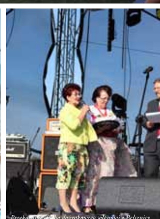
Przekazanie chleba dożynekowego sołtyśdowi z Bebznića