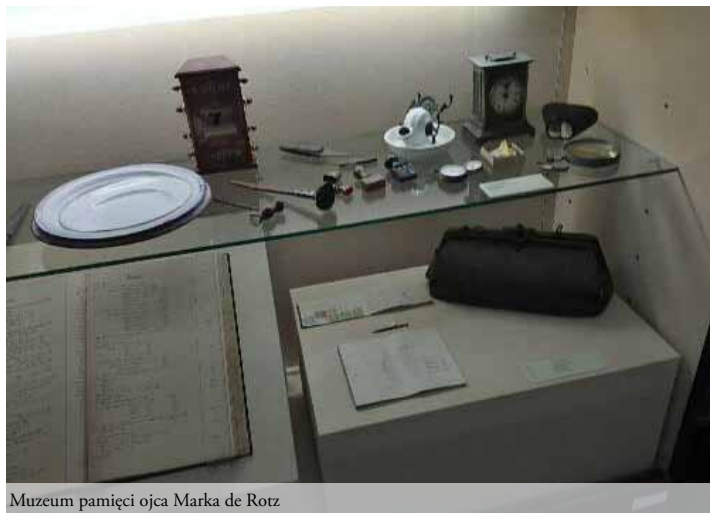
Muzeum pamięci ojca Marka de Rotz