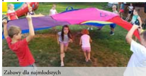
Zabawy dla najmłodszych

Otwarcu każdej z nich towarzyszyło wiele atrakcji dla mieszkańców naszych sołectw, a w szczególności dla najmłodszych. To właśnie z myślą o nich organizatorzy przygotowali wiele atrakcji: były zabawy w pianie (które mogły się odbyć dzięki strażakom z OSP Gorzyce), karuzele, zabawy z harcerzami i słodki poczęstunek.