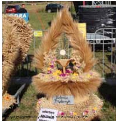
Korona przygotowana przez sekcję Kolonia Frydryk