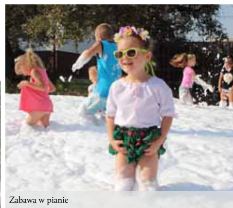
Zabawa w pianie