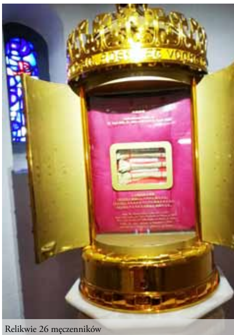
Relikwie 26 męczenników

Ten heroizm wiary, przewyższający okrucieństwo i nienawiść prześladowców, nie był ostatnią wspianą kartą w dziejach Kościoła w Japonii. Pozostała jeszcze wytrwałość. Po okrutnych prześladowaniach XVII wieku Kościół japoński zszedł do podziemia. Był to Kościół pozbawiony kapłanów, a tym samym wszystkich sakramentów, z wyjątkiem chrztu. To - w połączeniu z ustną katechazą - jednak wystarczyło. Pozostali przy życiu