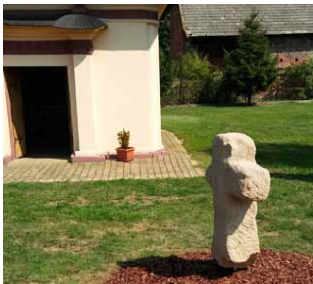
Krzyż pokutny w Olzie