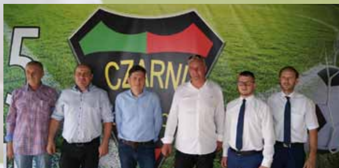
Goście przybyli na uroczystość