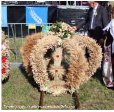
Korona przygotowana przez sołectwo Bebznića