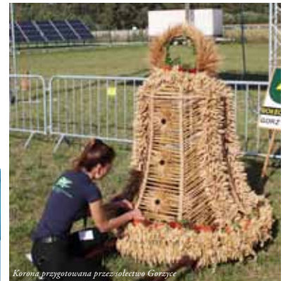
Korona przygotowana przez sekcję Górzycze