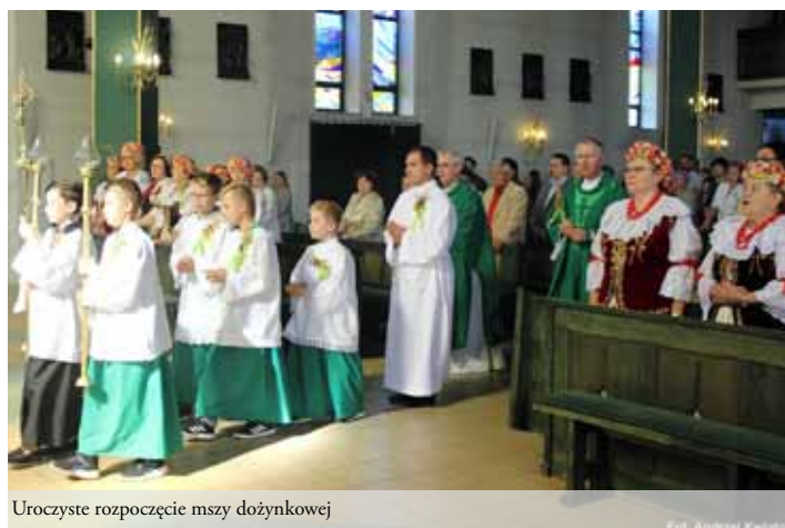
Uroczyste rozpoczęcie mszy dożynkowej