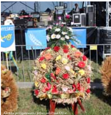
Korona przygotowana przez sołectwo Olza