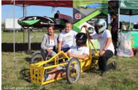
Siłistan great power