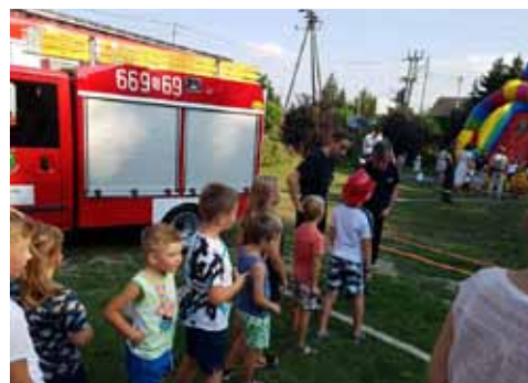
Zajęcia ze strażakami