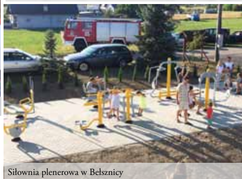
Siłownia plenerowa w Belsznicy