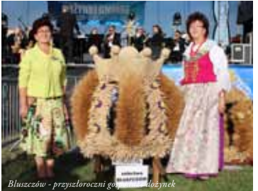
Bluszczów - przyszłoroczni gospodarze dożynki