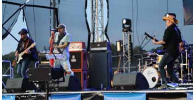
Występ zespołu Blend