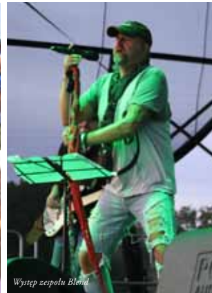
Występ zespołu Blend