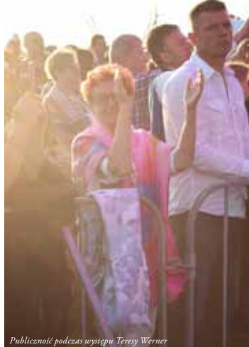
Publiczność podczas występu Teresy Werner