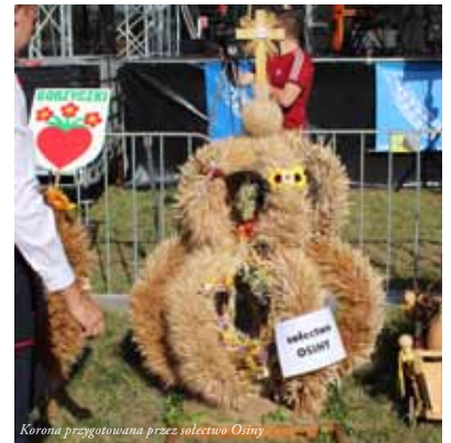
Korona przygotowana przez sekcję Osiny