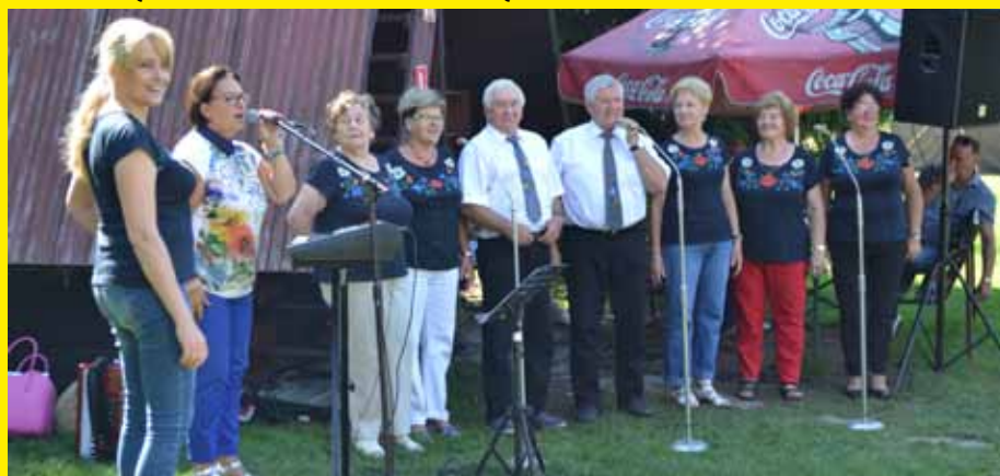
Zespół Olzanki podczas występu