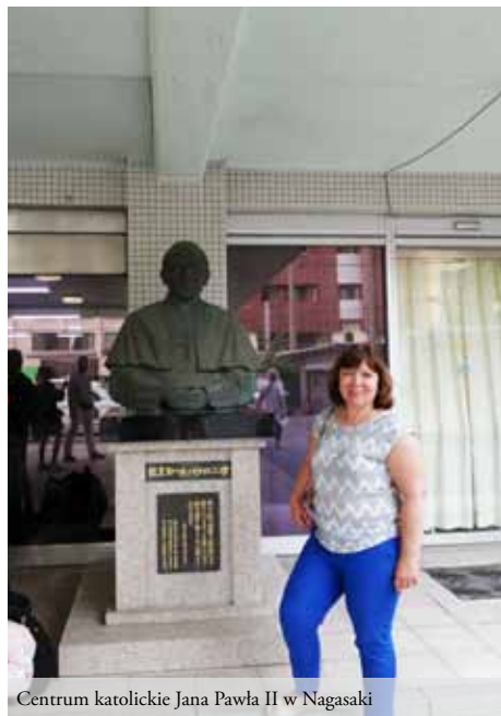
Centrum katolickie Jana Pawła II w Nagasaki