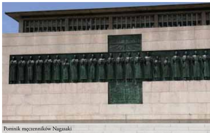
Pomnik męczenników Nagasaki