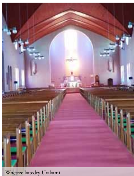
Wnętrze katedry Urakami

Początki ewangelizacji Japonii związane były ze służbą misyjną św. Franciszka Ksawerego. Święty Franciszek Ksawery by jezuitą, który dotarł do Japonii około 1549 roku, a pierwszy katolicki kościół został konsekrowany w Kioto w 1576 r. Rozwój chrześcijaństwa na tych wyspach był możliwy dzięki ogromnej i systematycznej pracy jezuitów, którzy uczyli nowych wiernych nie tylko miłości, miłosierdzia, ale również uczyli życia. Powstawały liczne ośrodki, gdzie młodzież mogła uczyć się i poznawać różne rzemiosła. W tym czasie społeczność chrześcijańska liczyła około 200 tys. osób. Przez modlitwę i pracę kształtowano dzieci od podstaw do życia w rodzinie i społeczeństwie. Ewangelizacja i rozwój chrześcijaństwa trwał bez zakłóceń do 1587 roku, do czasu, kiedy w pewnej miejscowości nowe chrześcijanki przeciwstawiły się byciu nałożnicami szoguna. Japończycy namiestnicy obawiający się o swoje stanowiska i utratę władzy zaczęli wyrzucać z urzędów i wojska chrześcijan. W tym czasie zakazano jezuitom prowadzenia działalności misyjnej oraz spalono ponad 200 katolickich kościołów. Oliwy do ognia dolewali protestanci – angielscy i holenderscy kupcy, którzy licząc na liczne zyski namawiali do prześladowania katolików i wskazywali miejsca ich schronienia lub ukrycia. Największe prześladowania katolików były na prowincji, gdzie wrogie zamiary okazywali buddyjscy duchowni tak zwani bonzowie. Celem prześladowań była całkowita eksterminacja katolików.