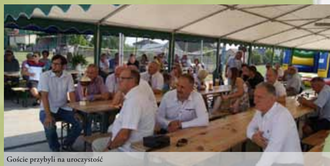
Goście przybyli na uroczystość