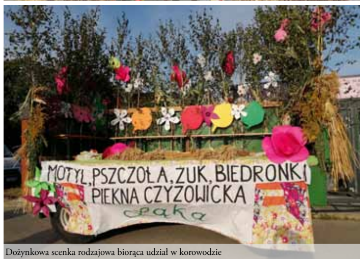
Dożynkowa scenka rodzajowa biorąca udział w korowodzie